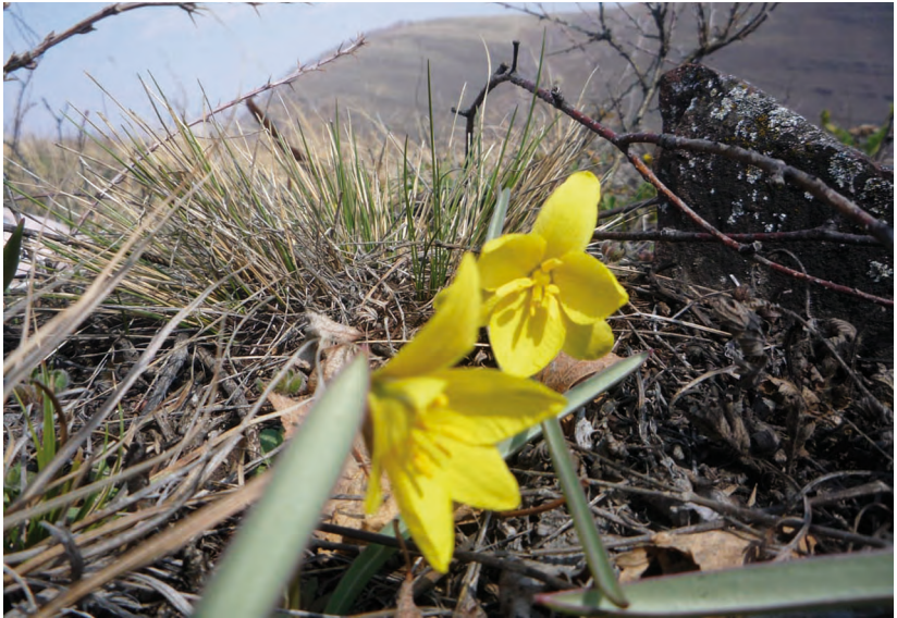
Tulipa uniflora (L.) Bess. ex Vake. – Тюльпан одноцветковый