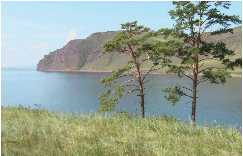
Сыдинский залив, Краснотуранский район, близ г. Унюк, окр. с. Краснотуранск