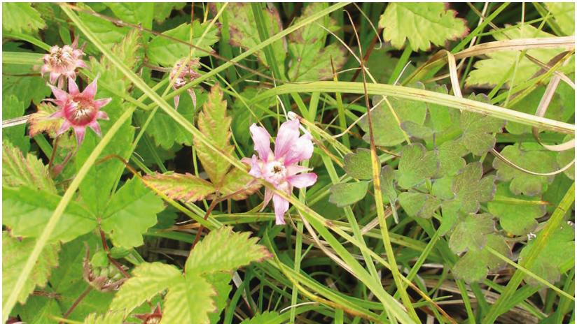
Rubus arcticus L. – Княженика арктическая