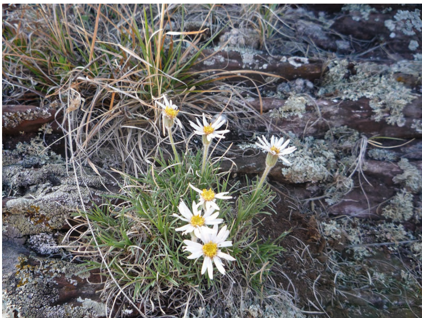
Arctogeron gramineum (L.) DC. – Арктогерон злаковый