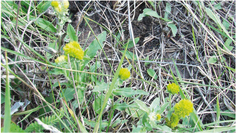
Helichrysum arenaria (L.) Moench. – Цмин песчаный, бессмертник