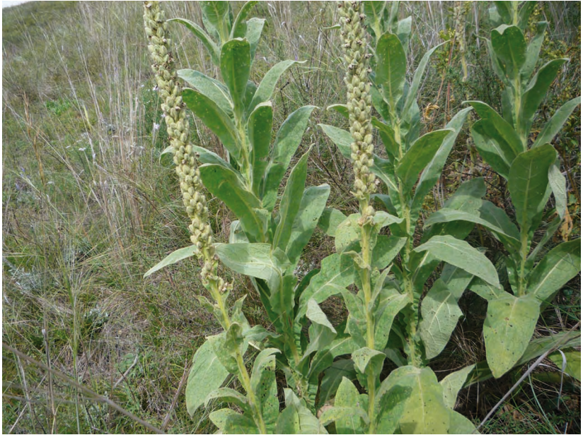
Verbascum thapsus L. – Коровяк обыкновенный