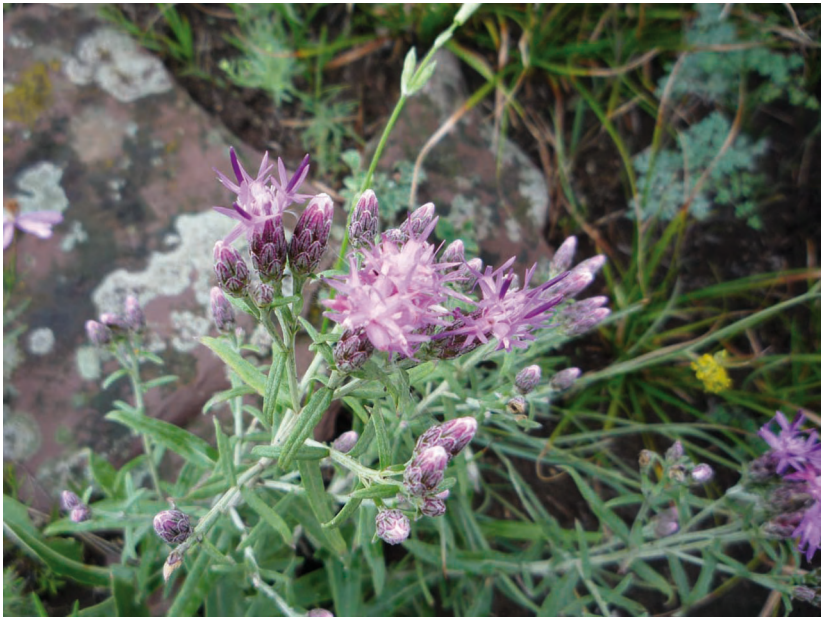
Saussurea davurica Adam. – Соссюрея даурская