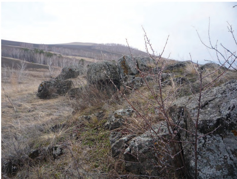
Курумы в степи, Краснотуранский район, окр. с. Лебяжье