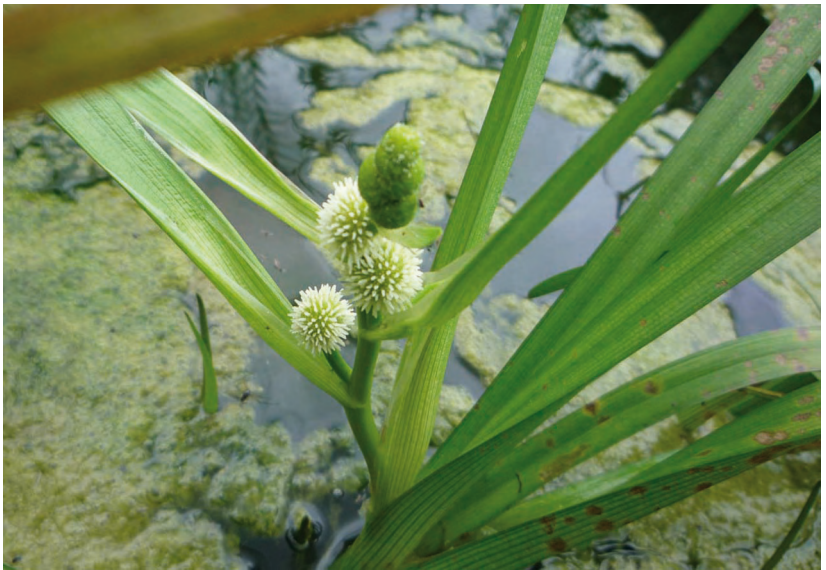
Sparganium glomeratum (Laest.) L. Neum. – Ежеголовник скученный