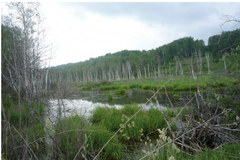
Осоковое болото, Курагинский район