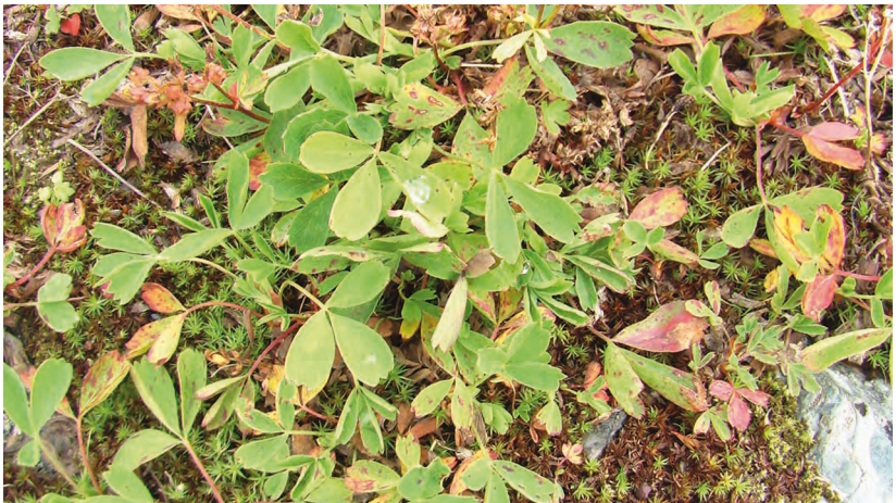
Sibbaldia procumbens L. – Сиббальдия стелющаяся