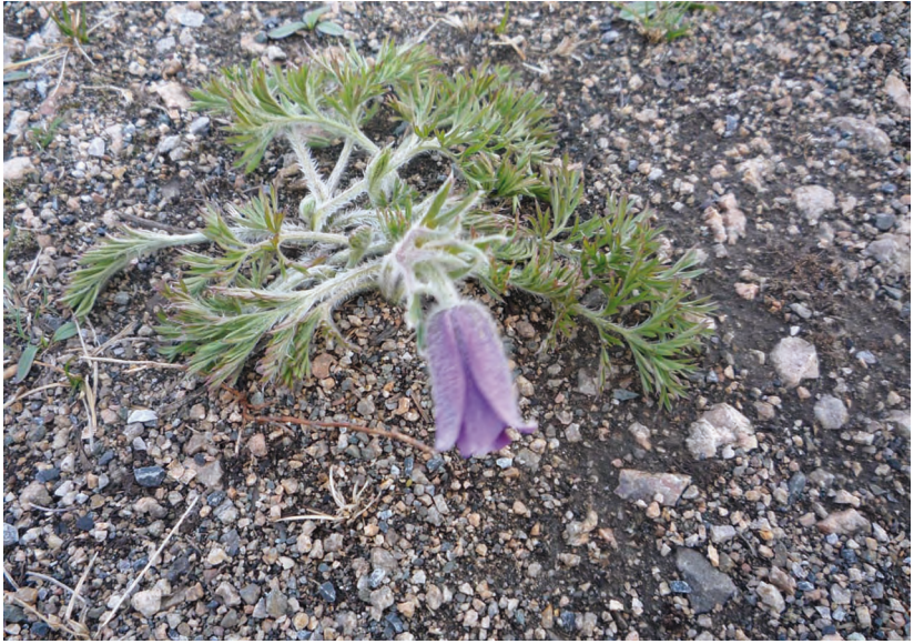
Pulsatilla bungeana С.А. Мей. – Прострел Бунге