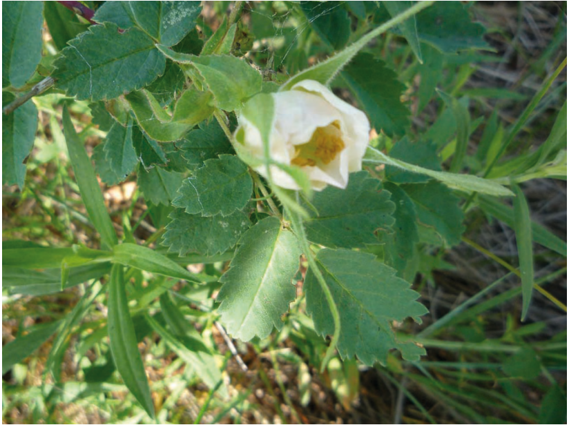
Rosa acicularis Lindl. – Роза (Шиповник) иглистая