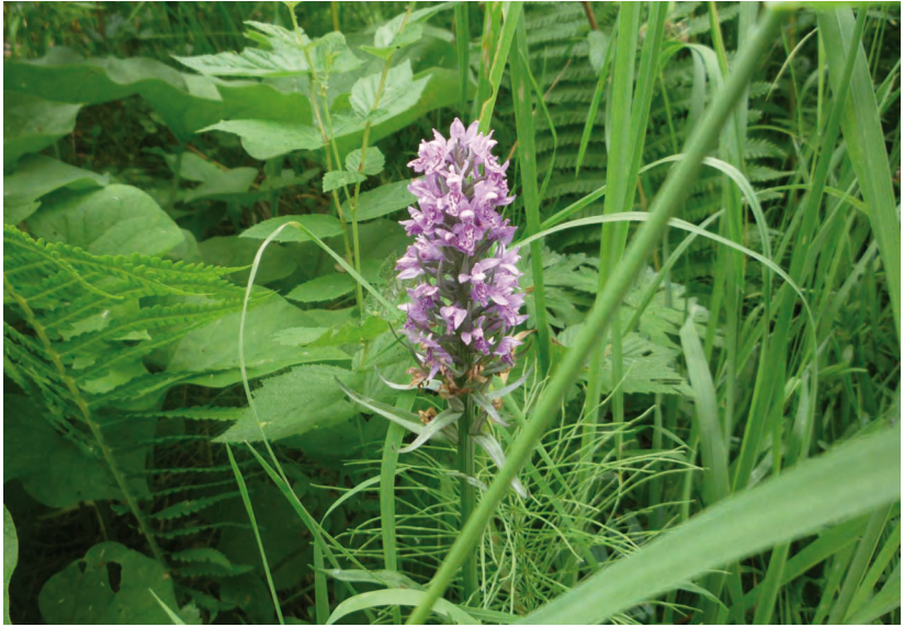
Dactylorhiza incarnata (L.) Soó – Пальчатокоренник мясо-красный