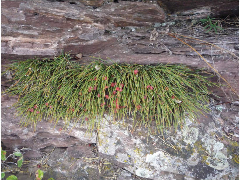
Ephedra monosperma С.А. Меу. – Хвойник односемянной