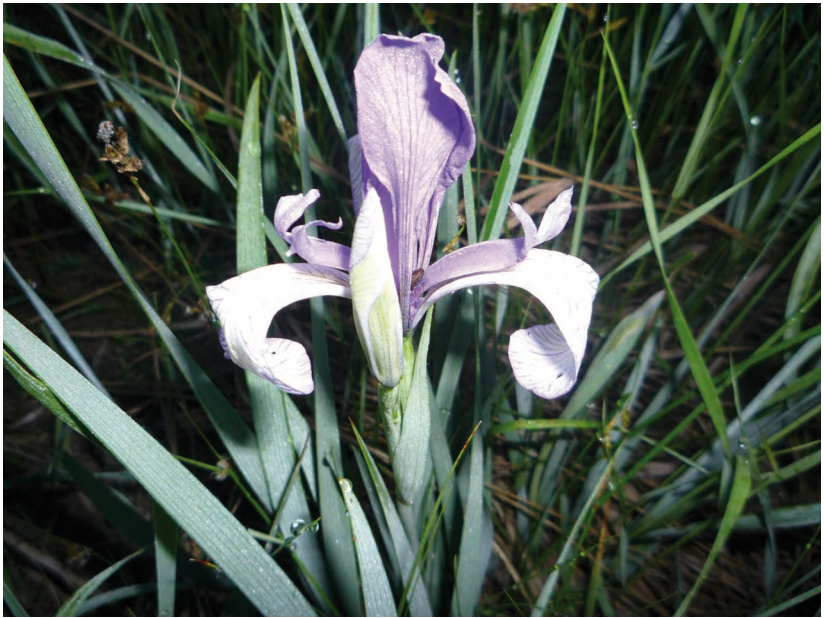
Iris lactea Pall. – Касатик молочно-белый