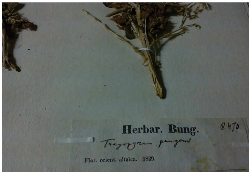
Историческая ценность Гебария БИН РАН им. Комарова, Санкт-Петербург