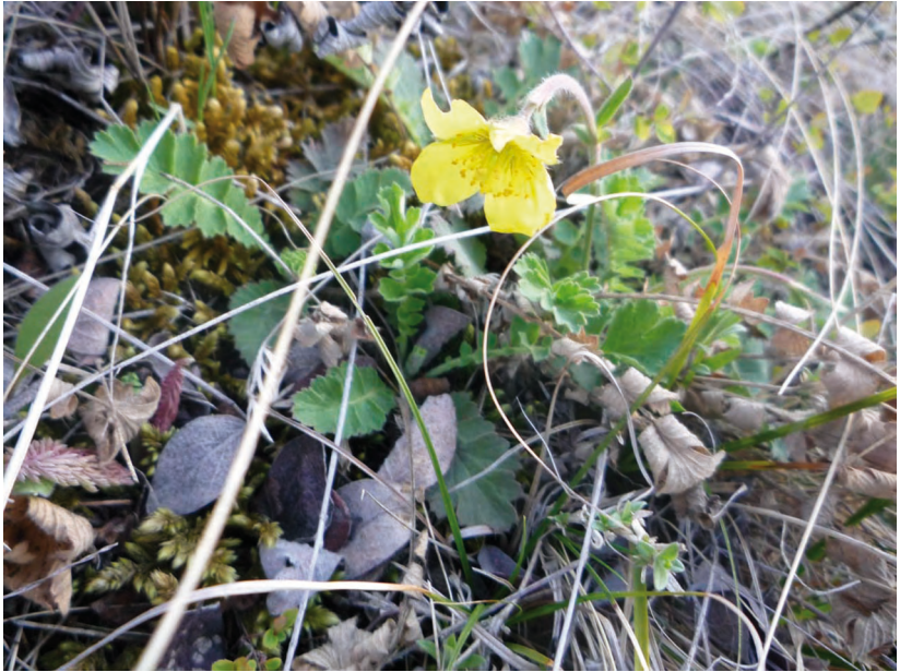
Coluria geoides (Pall.) Ledeb. – Колюрия гравилатовидная