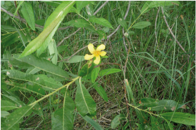
Hypericum ascyron L. Helichrysum arenaria (L.) Moench. – Зверобой большой