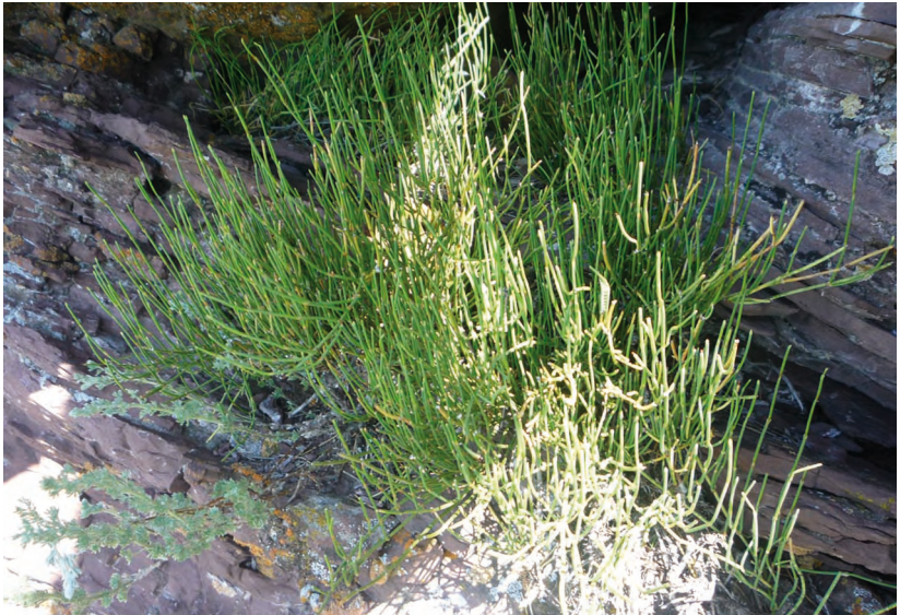
Ephedra equisetina Bunge. – Хвойник (Эфедра) хвощевидный