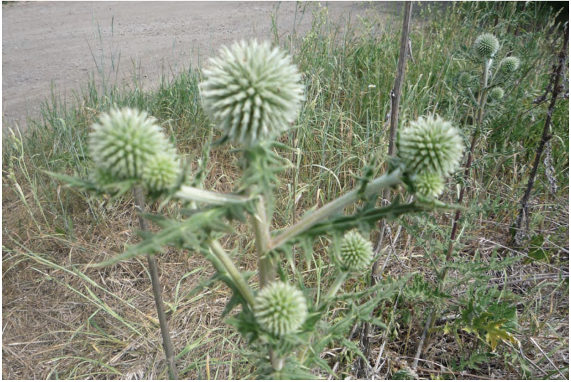
Echinopsis sphaerocephalus L. – Мордовник шароголовый