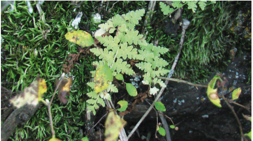
Cystopteris fragilis (L.) Bern. – Пузырник ломкий