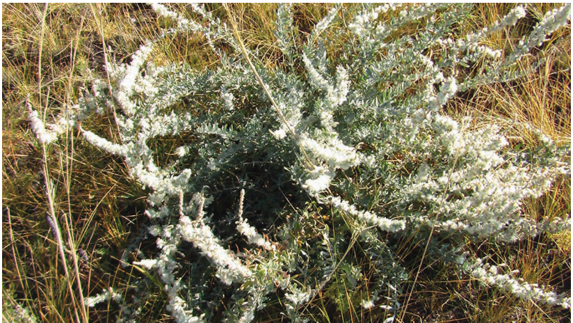
Krascheninnikowia ceratoides (L.) Gueldenst. – Крашенинниковия роговидная