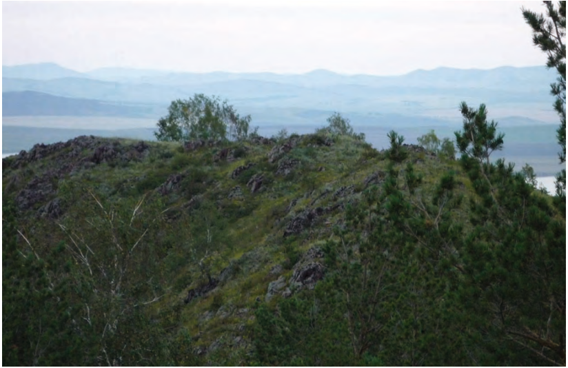
Самый большой курум – г. Маяк (230 м над уровнем моря) в Краснотуранском районе, окр. с. Краснотуранск