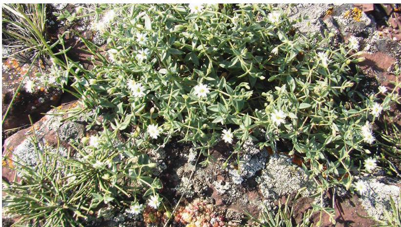
Mesostemma tartjanovii (Kryl.) Ikonn. – Мезостема Мартьянова