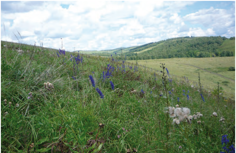
Delphinium dictyocarpum DC. – Живокость сетчатоплодная