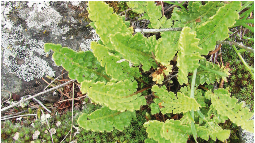
Woodsia ilvensis (L.) R. Br. – Вудсия эльбская