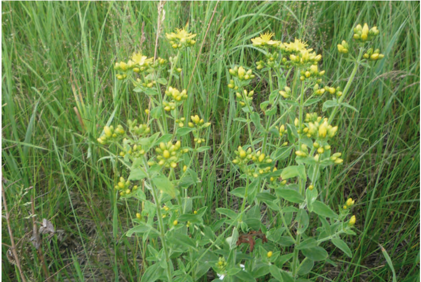
Hypericum hirsutum L. – Зверобой жестковолосый