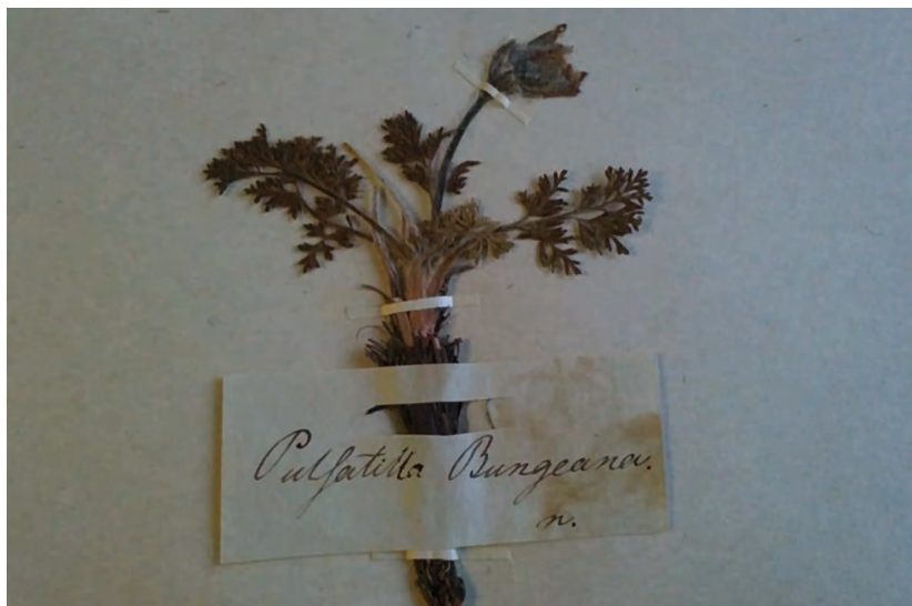
Гербарный лист из коллекции Бунге А.А. Гербарий БИН РАН им. Комарова, Санкт-Петербург