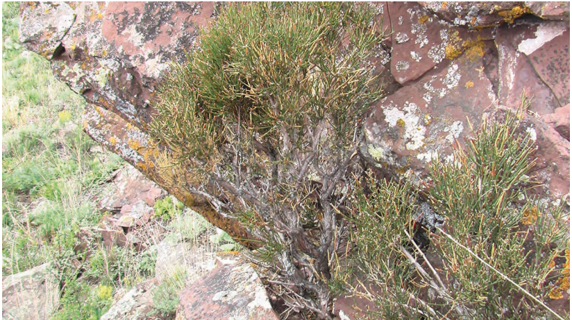
Ephedra pseudodistachya Рачот. – Хвойник ложнодвуколосковый