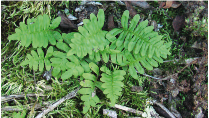
Polypodium sibiricum Sipl. – Многоножка сибирская