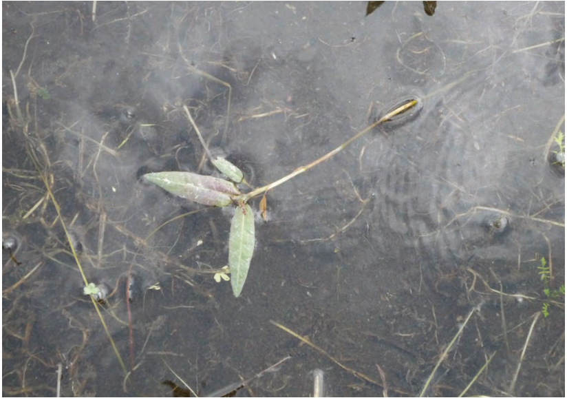
Potamogeton natans L. – Рдест плавающий