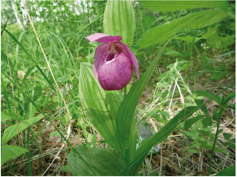
Cypripedium macranthum Sw. – Башмачок крупноцветковый