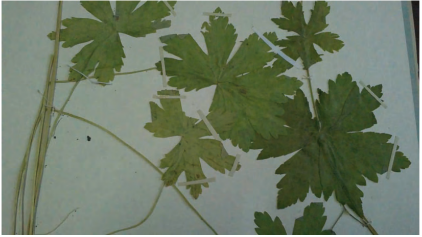
Geranium palustre L. – Герань болотная, Гербарий БИН РАН им. Комарова, Санкт-Петербург