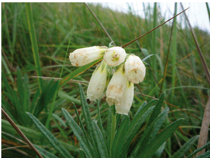
Onosma simplicissima L. – Оносма простейшая