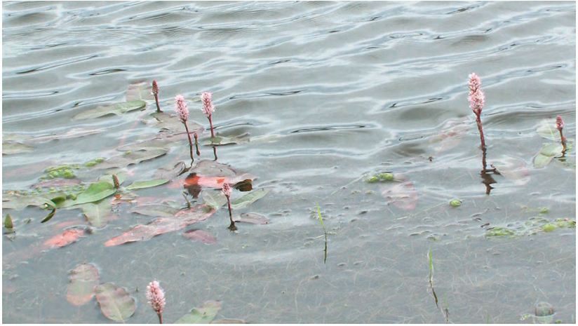
Persicaria amphibia (L.) Delarb. – Горец земноводный