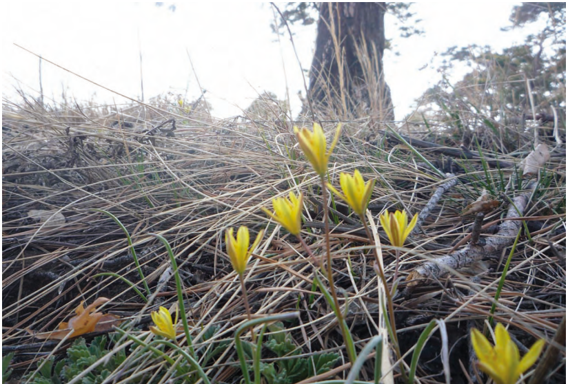
Gagea altaica Schischhk. – Гусинолук алтайский