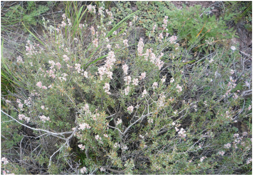
Atraphaxis frutescens (L.) C. Koch. – Курчавка кустарниковая