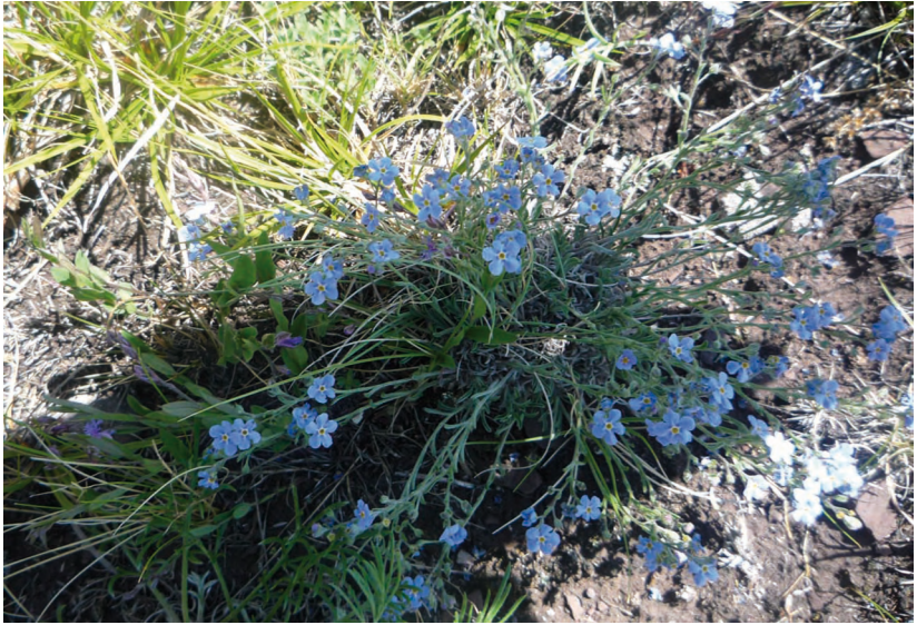
Eritrichium jensseense Turcz. ex DC. – Незабудочник енисейский