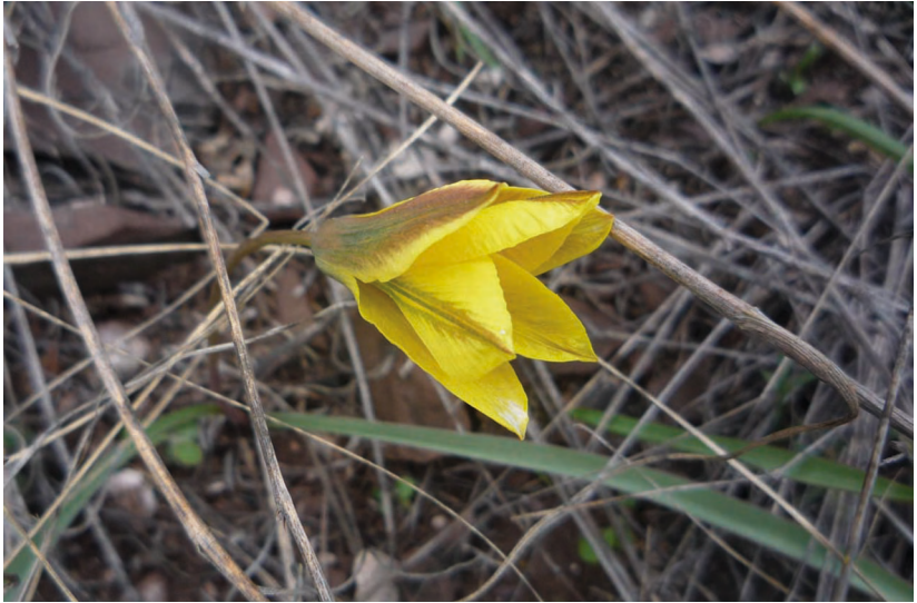
Tulipa heteropetala Ledeb. – Тюльпан разнолепестный