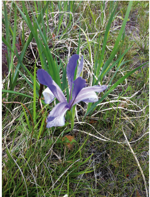
Iris halophila Pall. – Касатик солелюбивый