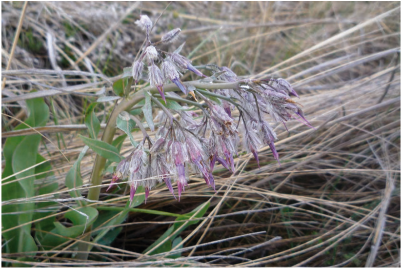
Rindera tetraspis Pall. – Риндера четырехцистинковая