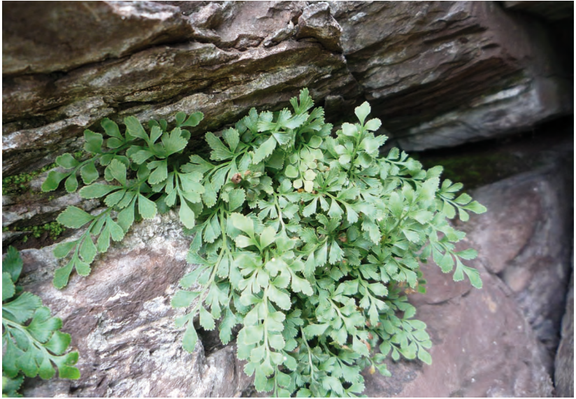
Asplenium ruta-muraria L. – Костенец рута постенная