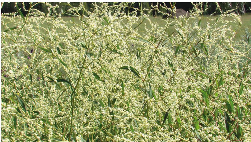
Aconogonon divaricatum (L.) Nakai ex Mori. – Таран растопыренный