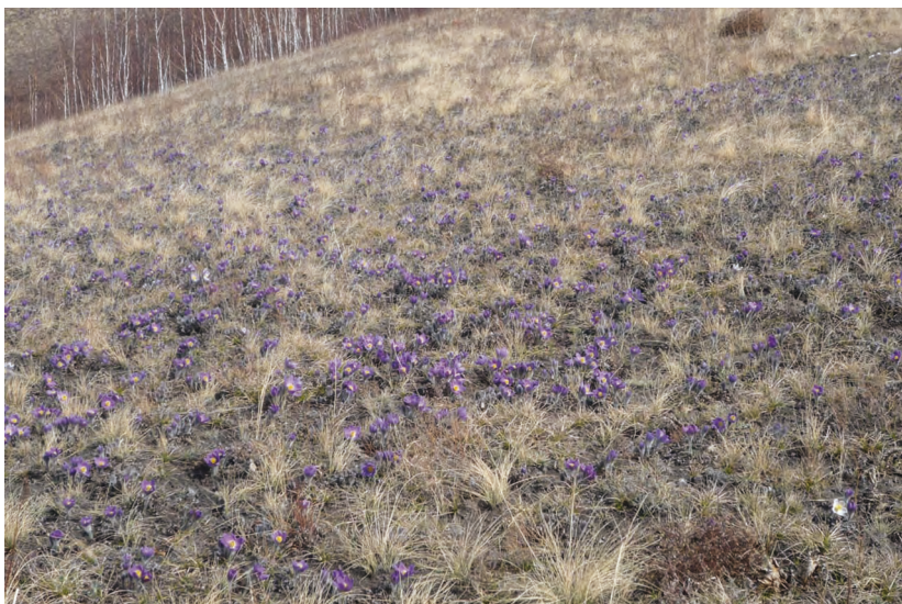
Прострелово-ковыльная степь, Краснотуранский район, г. Туран