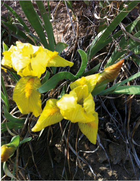
Iris bloudowii Ledeb. – Касатик Блудова