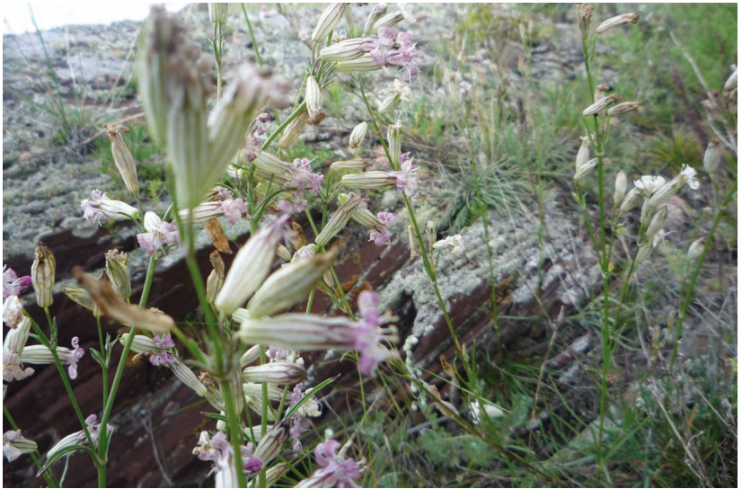
Silene graminifolia Otth. – Смолевка злаколистная