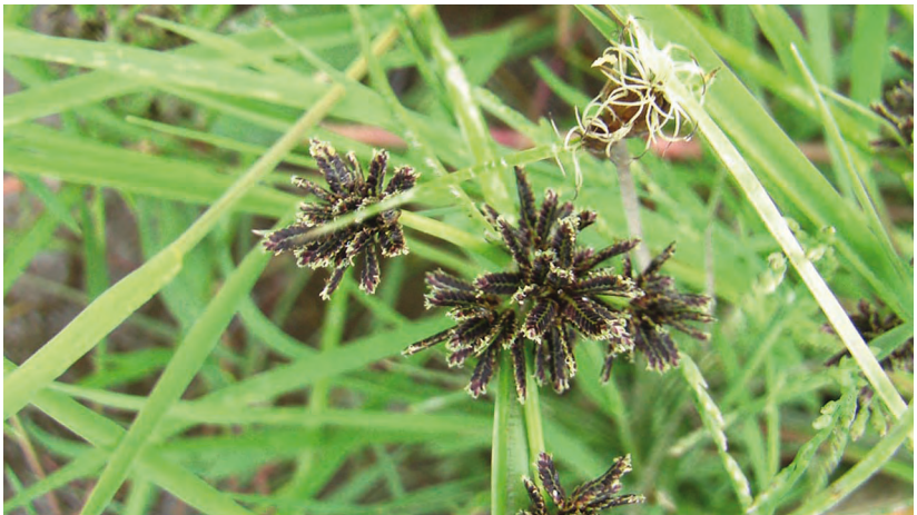
Cyperus fuscus L. – Сыть бурая