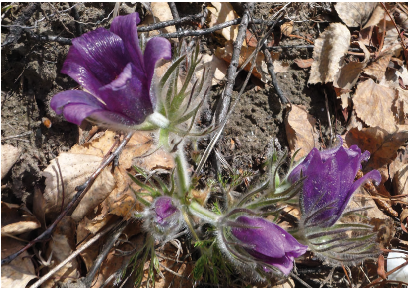
Pulsatilla ambigua (Turcz.) Jaz. – Прострел сомнительный