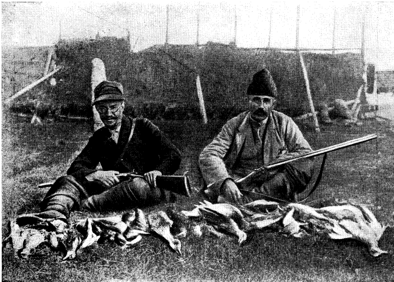
А. П. СЕМЕНОВ-ТЯН-ШАНСКИЙ и Н. А. ЗАРУДНЫЙ (справа)

Устье реки Великой (близ г. Пскова), август 1905 г.