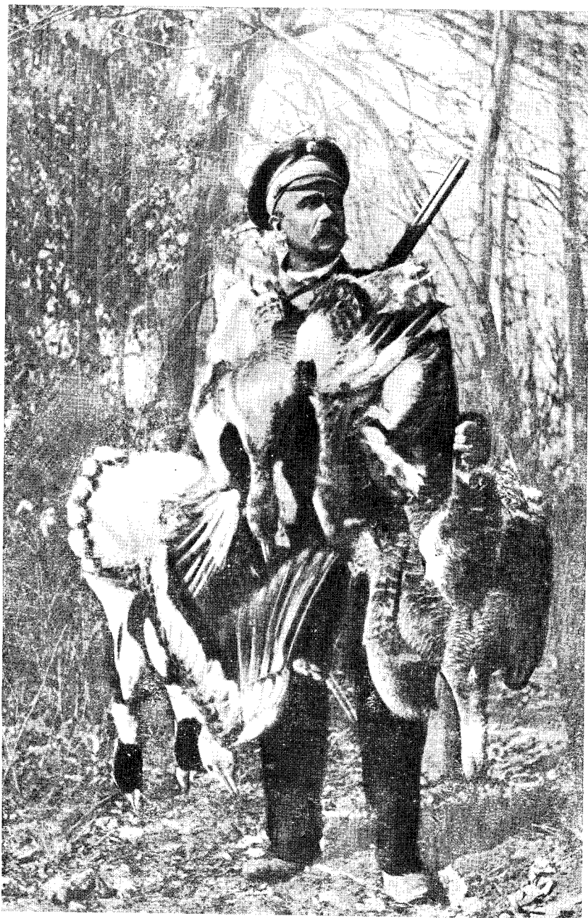
Н. А. Зарудный на охоте

и, ую не ла ой нь- те- ич д- ом ви- ед- оо- да, кс- ст. ная ие ла лся ко- о с ук. лай ль- ду- во- тер у и ле- нт- уль не- кы- ай- , а ую ар- На- 18). ет: тие сур- ных со- еди дце, зы- ями