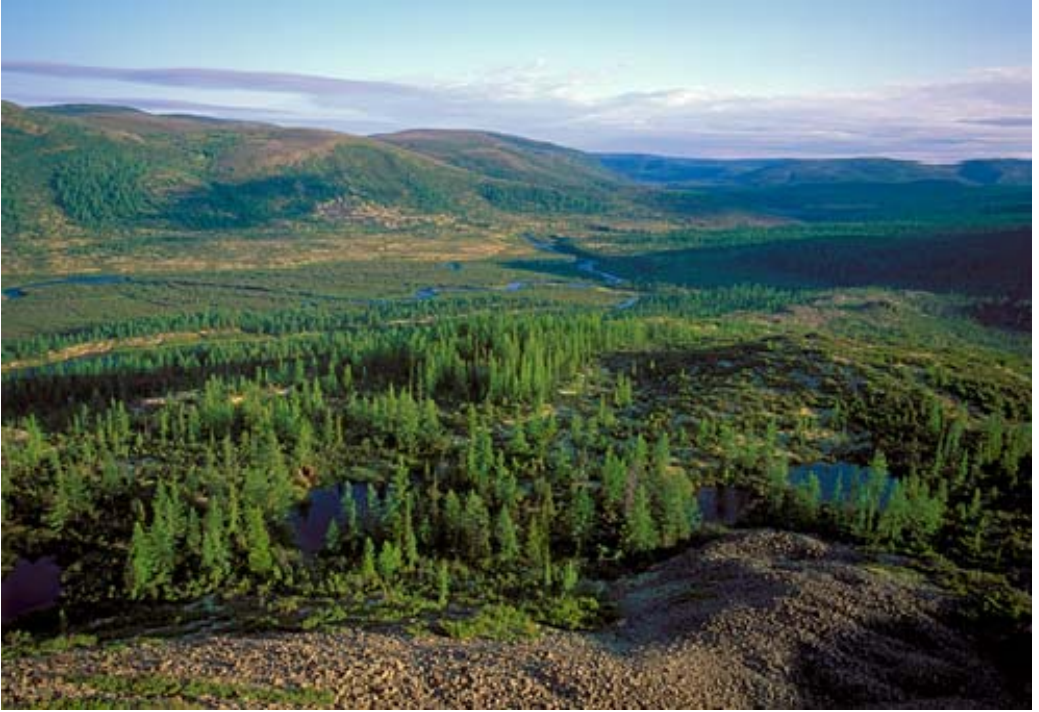
Рис. 6. Тайга Восточной Сибири

Климат восточно-сибирской тайги настолько отличен от климата европейской и западно-сибирской тайги, что выделяется в особый, восточно-сибирской подтип климата. В отличие от западного подтипа климатов двух первых таежных районов, для которого характерна весьма облачная и богатая осадками зима, климат Восточной Сибири характерен, прежде всего, ясной, малоснежной зимой.