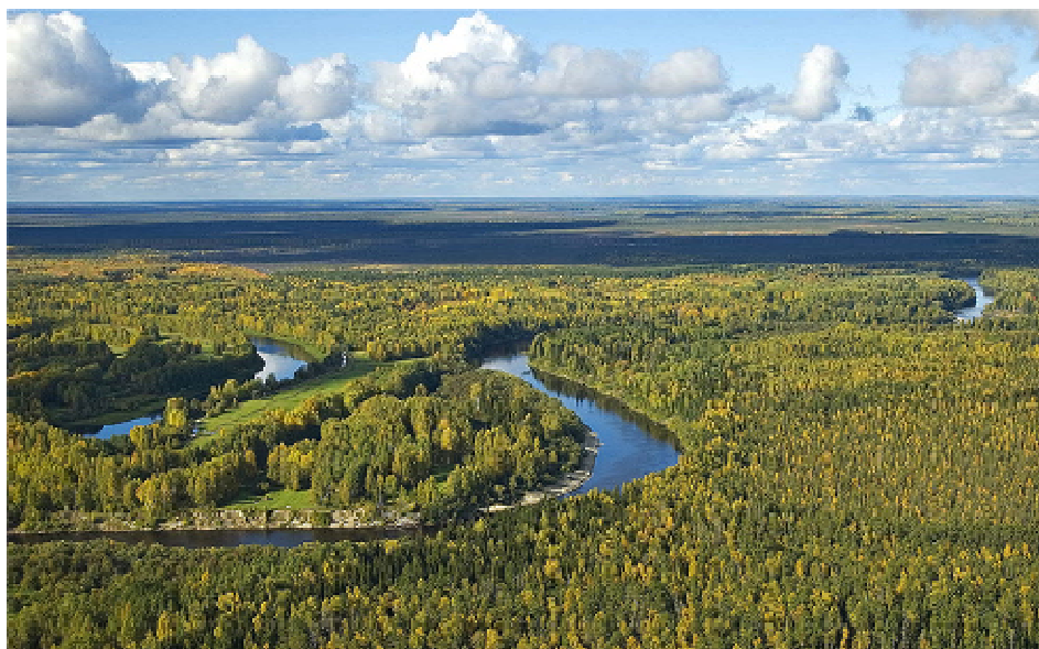
Рис. 5. Река Васюган в среднем течении