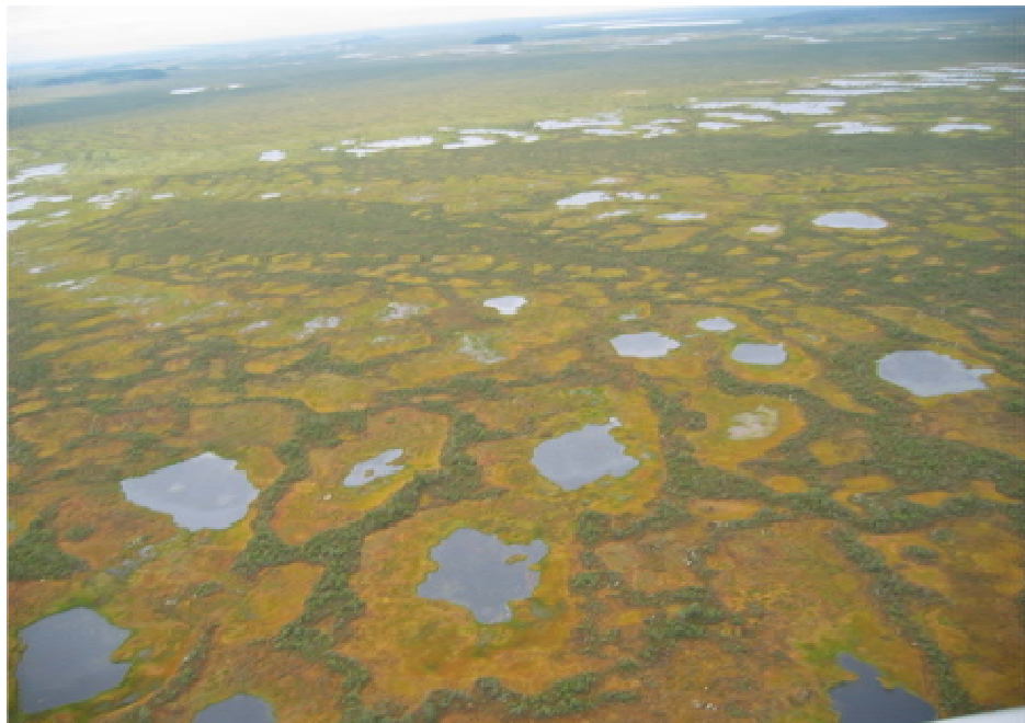
Рис. 4. Типичный ландшафт Васюганских болот