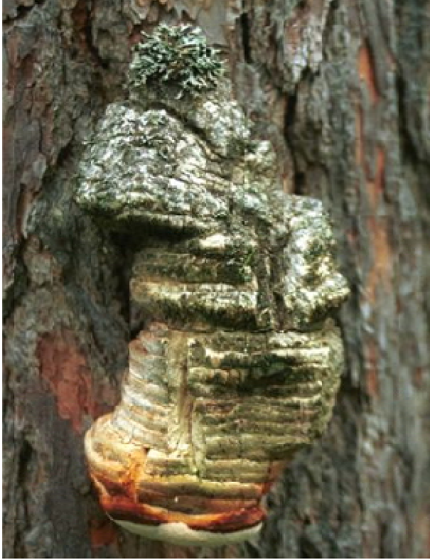
Рис. 9. Плодовое тело гриба Fomitopsis officinalis

В бассейне р. Олекмы в 40-50-летнем багульниково-моховом лиственничнике раком было поражено 60% деревьев, а в 36-летнем бруснично-багульниковом лиственничнике – 38%. В другом случае, по р. Лене в Орджоникидзевском районе на опушке 30-летнего молодняка бруснично-мохового типа леса обнаружено 95% пораженных деревьев, при наличии большого количества раковых ран на стволах.