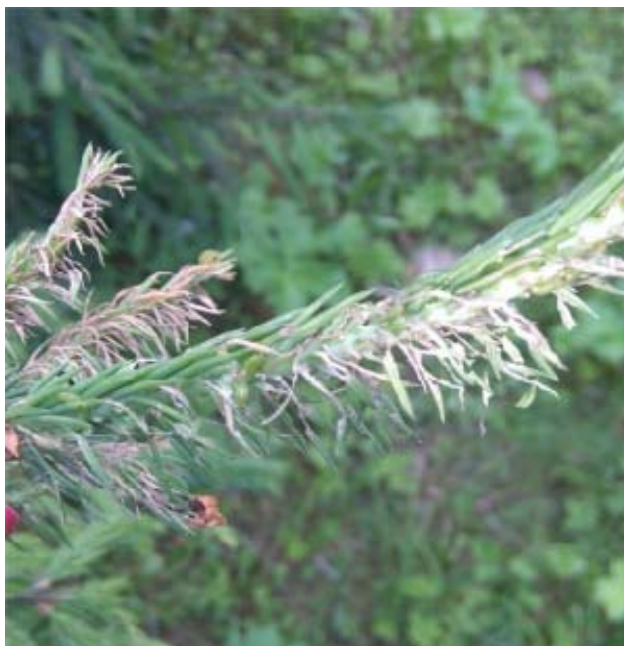
Рис. 10. Типичные повреждения еловой хвои личинками обыкновенного елового пилильщика

Обыкновенный, или малый еловый пилильщик летает с конца апреля – в мае и в начале июня. Личинки с краев объедают хвою только молодых, майских побегов, отчего поврежденные хвоинки надламываются в нижней части, усыхают и краснеют, характерно обвисая на побегах (рис. 10). Зимуют личинки в коконах, в подстилке под кормовыми деревьями. Генерация вредителя одногодная.