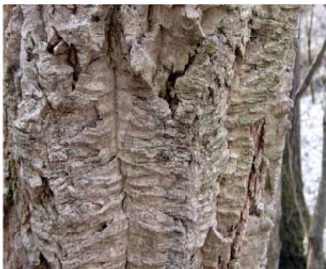
Рис. 12. Кора бархата амурского

В хвойно-лиственных насаждениях Дальнего Востока отмечены вспышки массовых размножений некоторых листо- и хвоегрызущих вредителей. В захламленных местах рубок, в ослабленных чем-либо, чаще всего хвойных, насаждениях размножаются стволовые вредители.