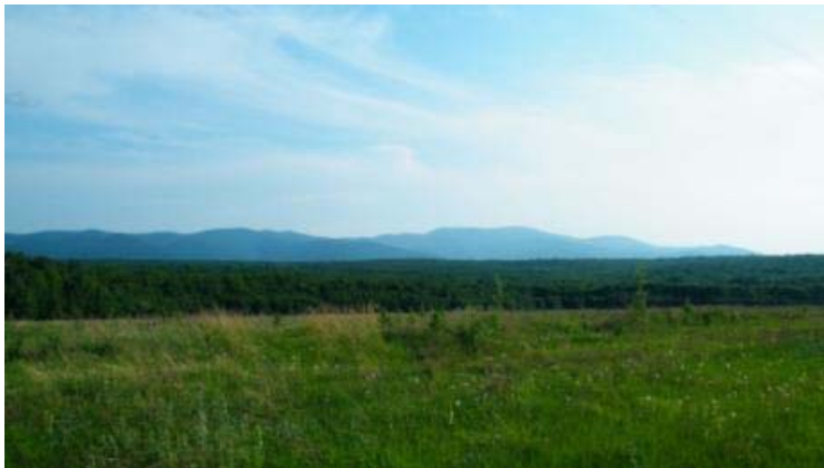
Рис. 11. Типичный безлесный ландшафт Среднеамурской низменности

В юго-западной части Зейско-Бурейской низменности распространены черные, луговые полуболотные и оподзоленные почвы, похожие на чернозем; другим районам этой и других низменностей свойственны менее плодородные, также полуболотные почвы (местами имеются подзолистые почвы).