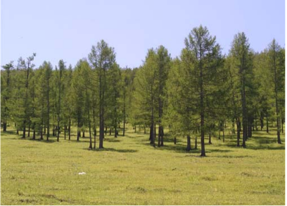
Рис. 7. Молодой лиственничный древостой

На севере тайги распространены редкостойные, низкобонитетные, заболоченные лиственничники, на почвах с неглубокой вечной мерзлотой встречается более производительная лиственничная, брусничная тайга. На хорошо дренированных и песчаных почвах произрастают высокобонитетные лиственничные и сосновые боровые насаждения. Естественное возобновление даурской лиственницы обычно хорошее. В местах гарей часто встречаются заросли: кустарниковый, березы – «ерники», состоящие из низкорослой березы ( Betula exilis Sukacz.). Среди тайги характерны многочисленные лесные луга на заболоченных почвах («аласы») в местах неглубокого залегания вечной мерзлоты.