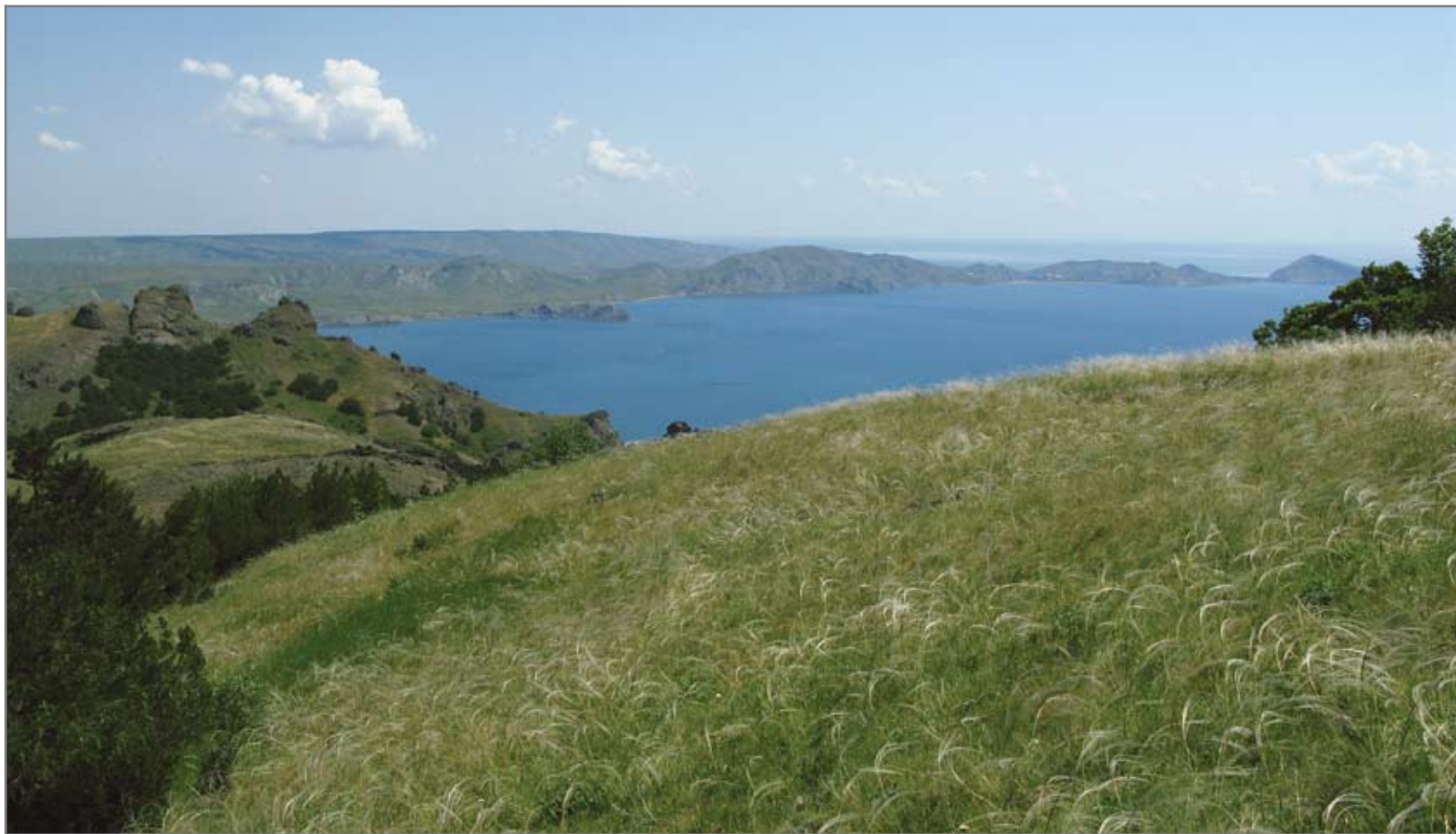
Рис. 6 _____ Ковыльно-типчаковая степь на хребте Магнитный.