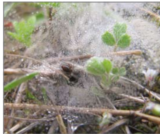
Рис. 8 _____ Сеточки молодых Agelena orientalis блестят от росы на солнце.