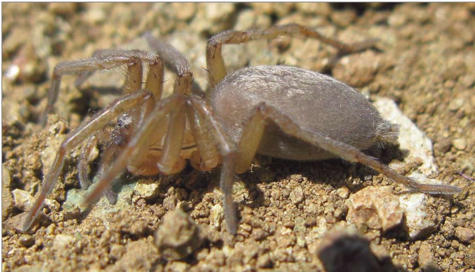
Рис. 47 _____

Самка Drassodes lapidosus . Фото Н.М. Ковблюка