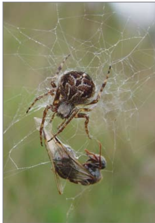
Рис. 18 _____ Самка Agalenatea redii с добычей.