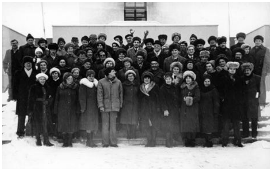
Таллин. Совещание по Северу