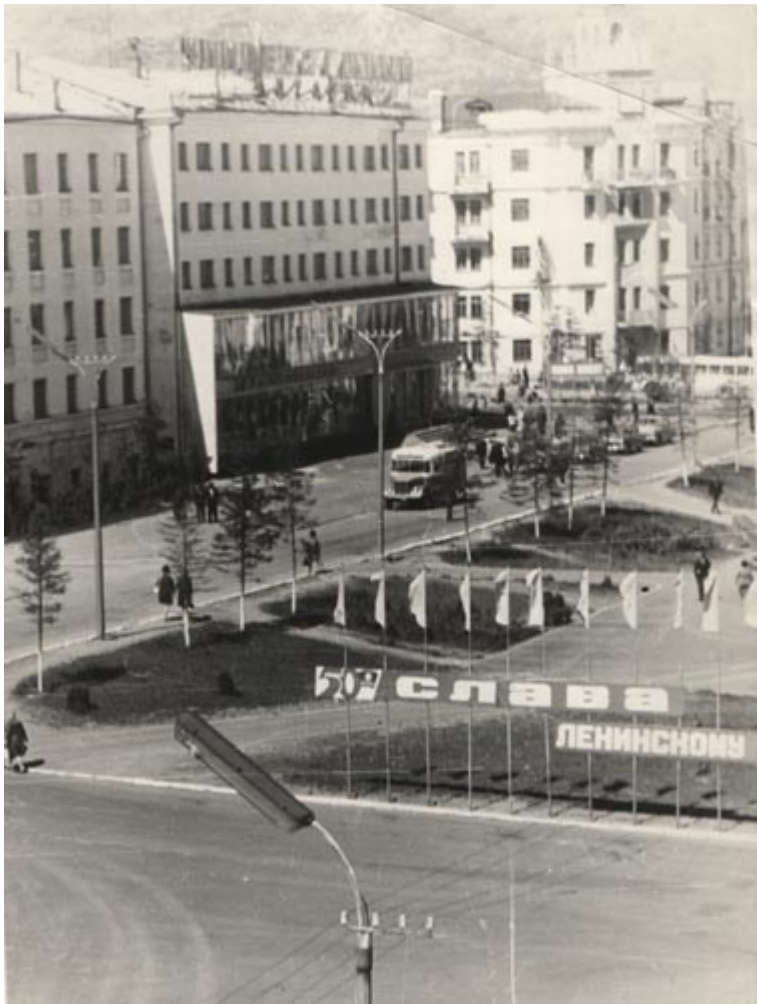
Магадан, 1971 год