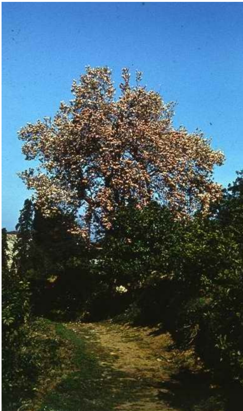
Магнолия Суланджа на Зеленом мысу

Четыре дня уходят на поиски и аренду машины. Нашли микроавтобус с большим багажником на крыше, что очень удобно для сушки гербария. Наш шофер – Тамаз Абашидзе, приятной наружности, худощавый, доброжелательный. наших внушек на время поездки в Турцию оставляем на попечение моей подруге, сотруднице Батумского ботанического сада Маше Овчинниковой.