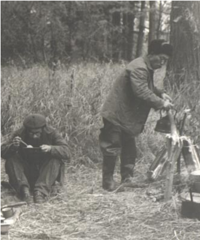
р. Яма, 20 сентября 1970 г.

Живем мы в просторной десятиместной палатке. При входе ставим маленькую печку-буржуйку. Вечерами заморозки. Да и летом погода бывает очень холодной. Нужно сушить газеты, гербарий. Все последующие магаданские годы мы не расставались с нашей палаткой, которая стала нашим летним домом. Внутри в ряд надувные матрасы со спальными мешками, печка. Вечерами, ложась спать, мы выкуривали свечкой комаров, плотно застегивали вход. Искры из трубы, попадая на брезент, прожгли дыры, сквозь них просматривались звезды, а утро нас встречало тенью от деревьев на крыше палатки, раскалявшейся на утреннем солнце. Так было все 15 лет. Я часто задумывалась – где наш настоящий дом: в Магадане, в Москве или в палатке?