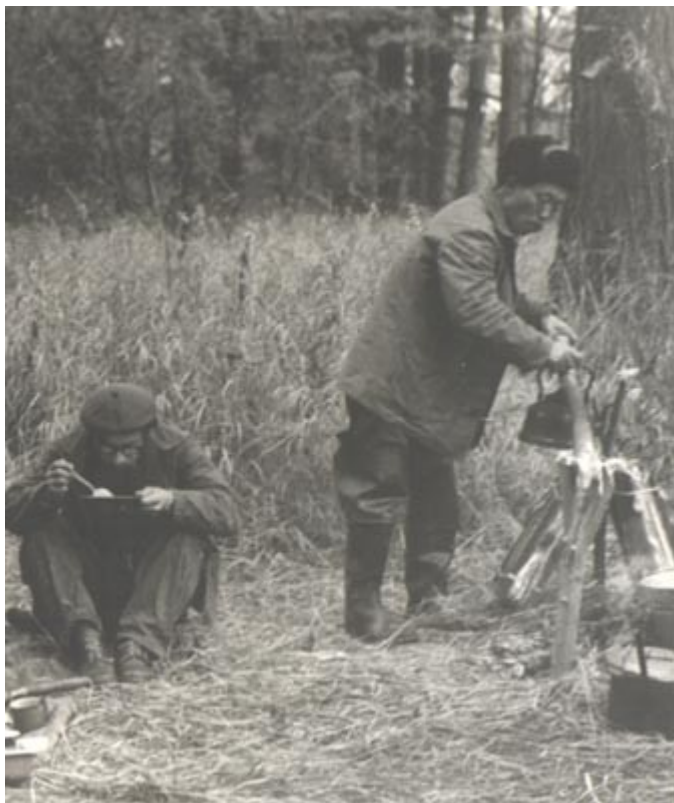
р. Яма, 20 сентября 1970 г.