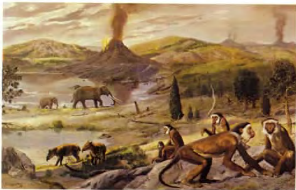
Mesopithecus pentelici (olej z roku 1977)