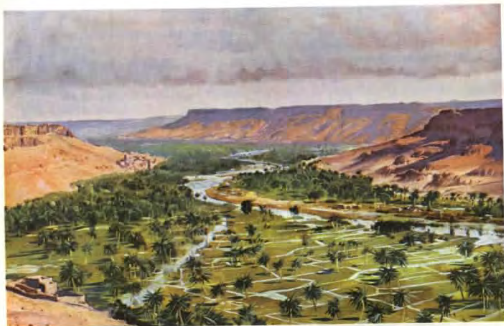
Údolí řeky Ziz v Maroku — olej z roku 1935. Tento obraz byl reprodukován v knize Ilustrovaný zeměpis všech dílů světa (1949)