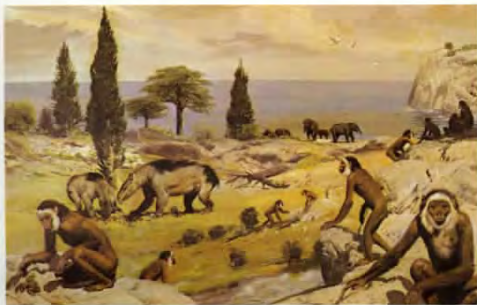
Pliopithecus vindobonensis (olej z roku 1977)