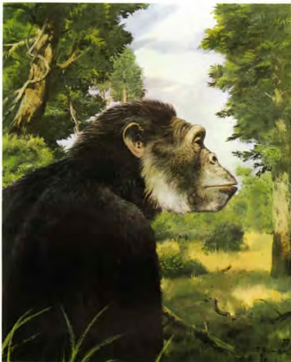
Sivapithecus indicus (olej z roku 1981)