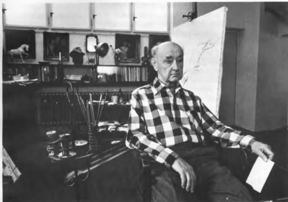
Zdeněk Burian ve svém ateliéru (1981)