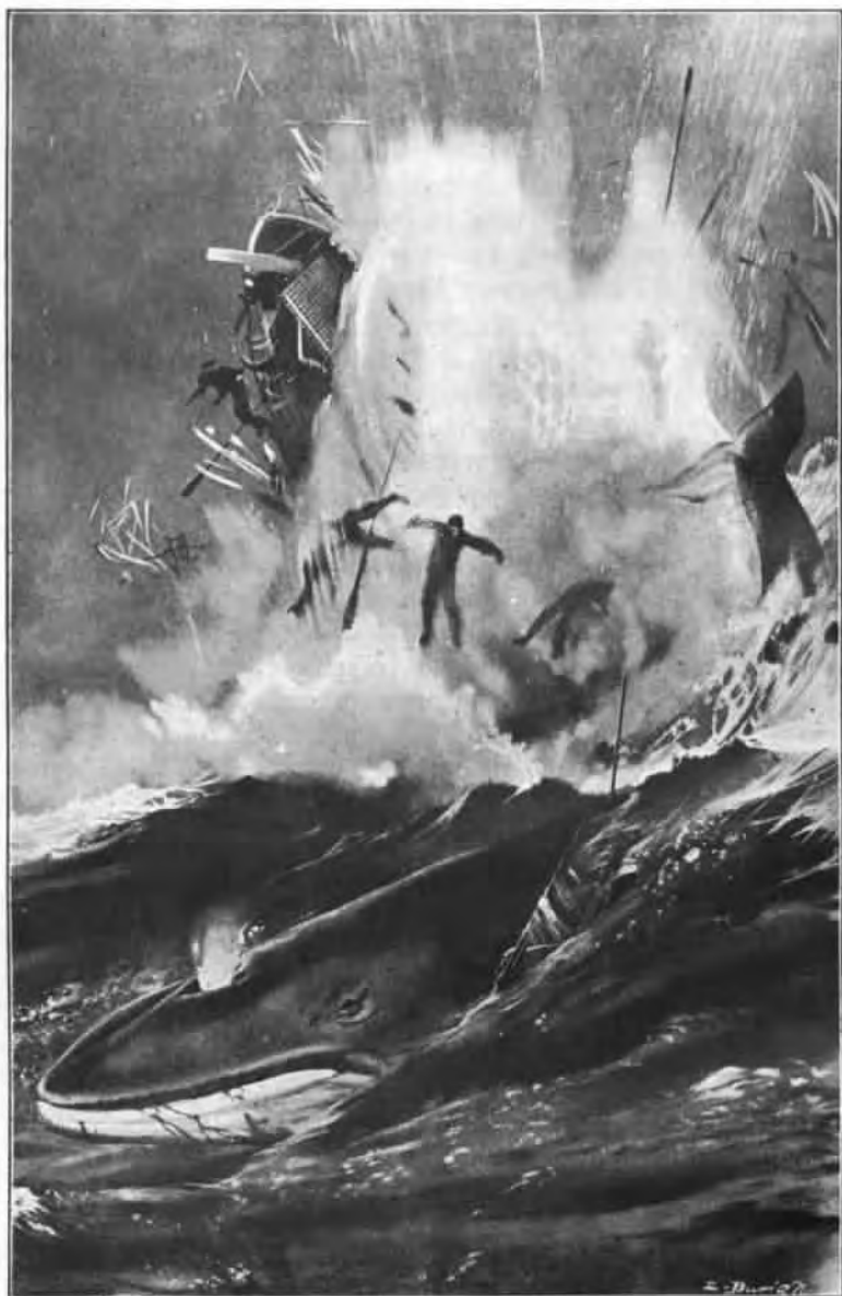
Ilustrace ke knize J. Verna Patnáctiletý kapitán, jež byla vydána r. 1938 v nakladatelství J. R. Vilímka (kvaš, 1938)