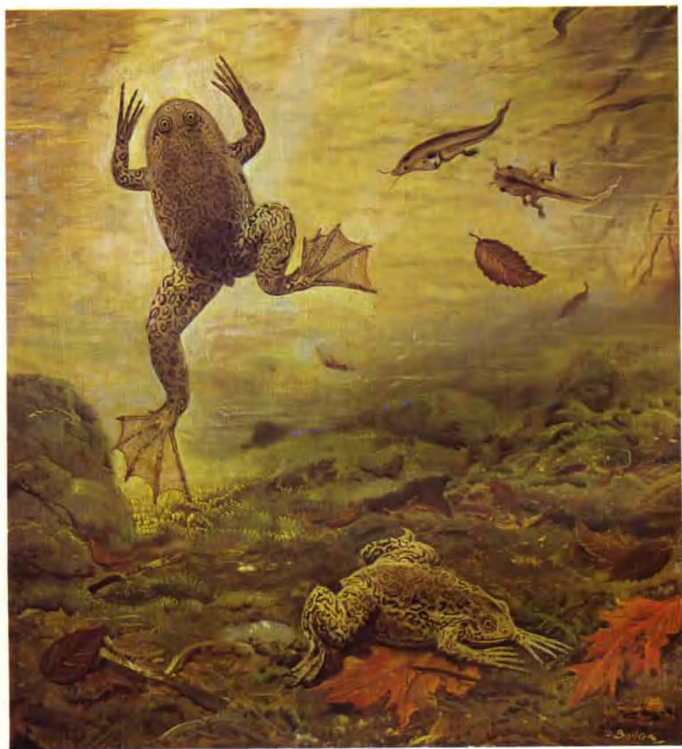
Palaeobatrachus grandipes (olej z roku 1969)