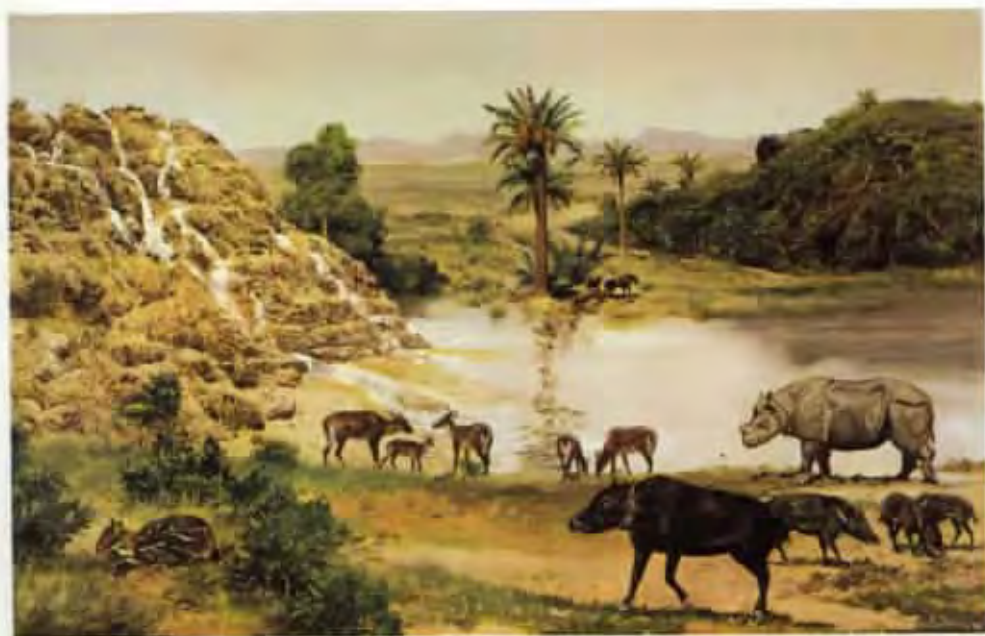
Krajina středních Čech v miocénu (olej z roku 1976)