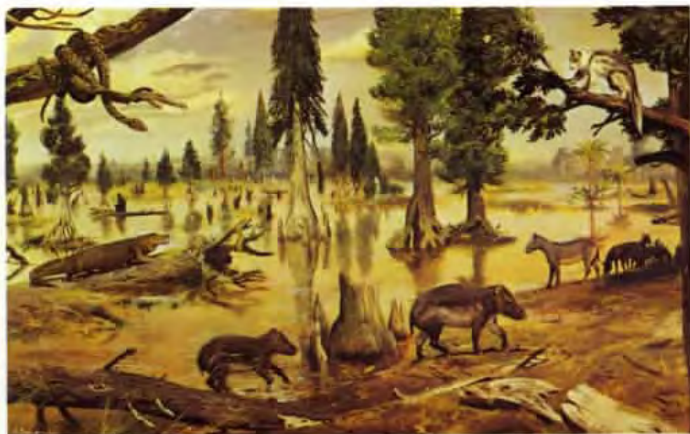
Fauna eocenních močálů (olej z roku 1976)