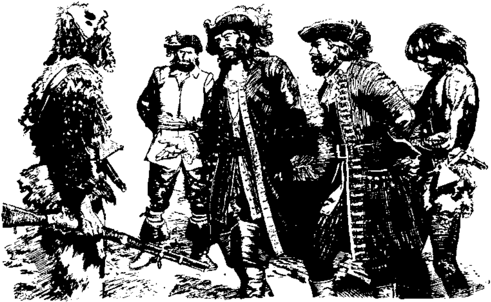
Jedna z mnoha ilustrací ke světoznámé knize D. Defoa Robinson Crusoe (perokresba tuší, přibližně 1955)

Burianovy ilustrace, v nichž dokázal autor spojit veristickou přesnost detailu s představivostí, byly a jsou i přes nepřízeň části výtvarné kritiky, která se snaží vytlačit ilustrace dobrodružné literatury Burianova rodokmenu až na periferii výtvarného dění, přijímány nejširším spektrem čtenářů. Uvedu zde dva zajímavé názory našich umělců: „... máme nepřetržitou sérii ilustrátorů od Mánesa, Alše, Kašpara přes Scheinera, Marolda až ke Zdeňku Burianovi. I ten Burian je světová třída ve své oblasti“. /15/ Tato slova vyřkl na adresu Buriana národní umělec Jiří Trnka, nechme ale také promluvit národního umělce Adolfa Hoffmeistera: „... Ze všech ilustrátorů, kteří se pokusili najít svou formu ilustrací pro Vernovy romány, líbí se mi nejlépe ilustrace Zdeňka Buriana, zejména tam, kde končí jeho přehnaný realismus a kde ho přebíjí Burianova bezostyšná virtuozita a grafická technologie. Víím, že moderní kritika bude tuto oslavnou větu pokládat za zradu na moderní uměnovědě, ale je tomu tak“. /16/