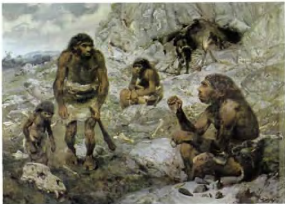
Homo sapiens neanderthalensis (olej z roku 1954)