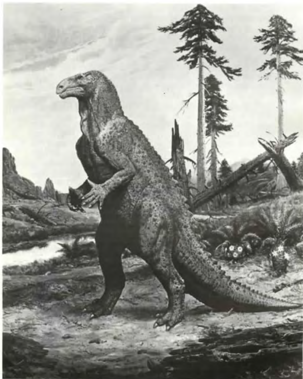
Iguanodon bernissartensis (olej z roku 1979)