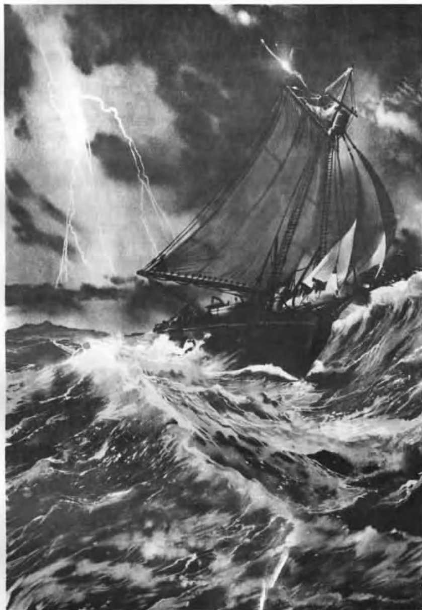
Kvašová ilustrace ke knize R. Kiplinga Stateční kapitáni (J. R. Vilímek, 1937)