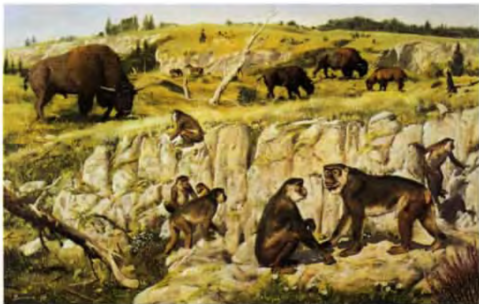
Macaca florentina a Bison priscus (olej z roku 1977)