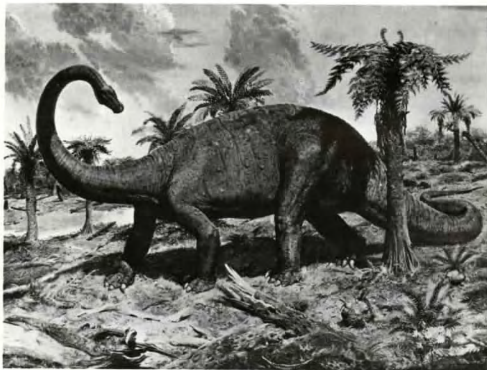
Diplodocus longus (olej z roku 1978)