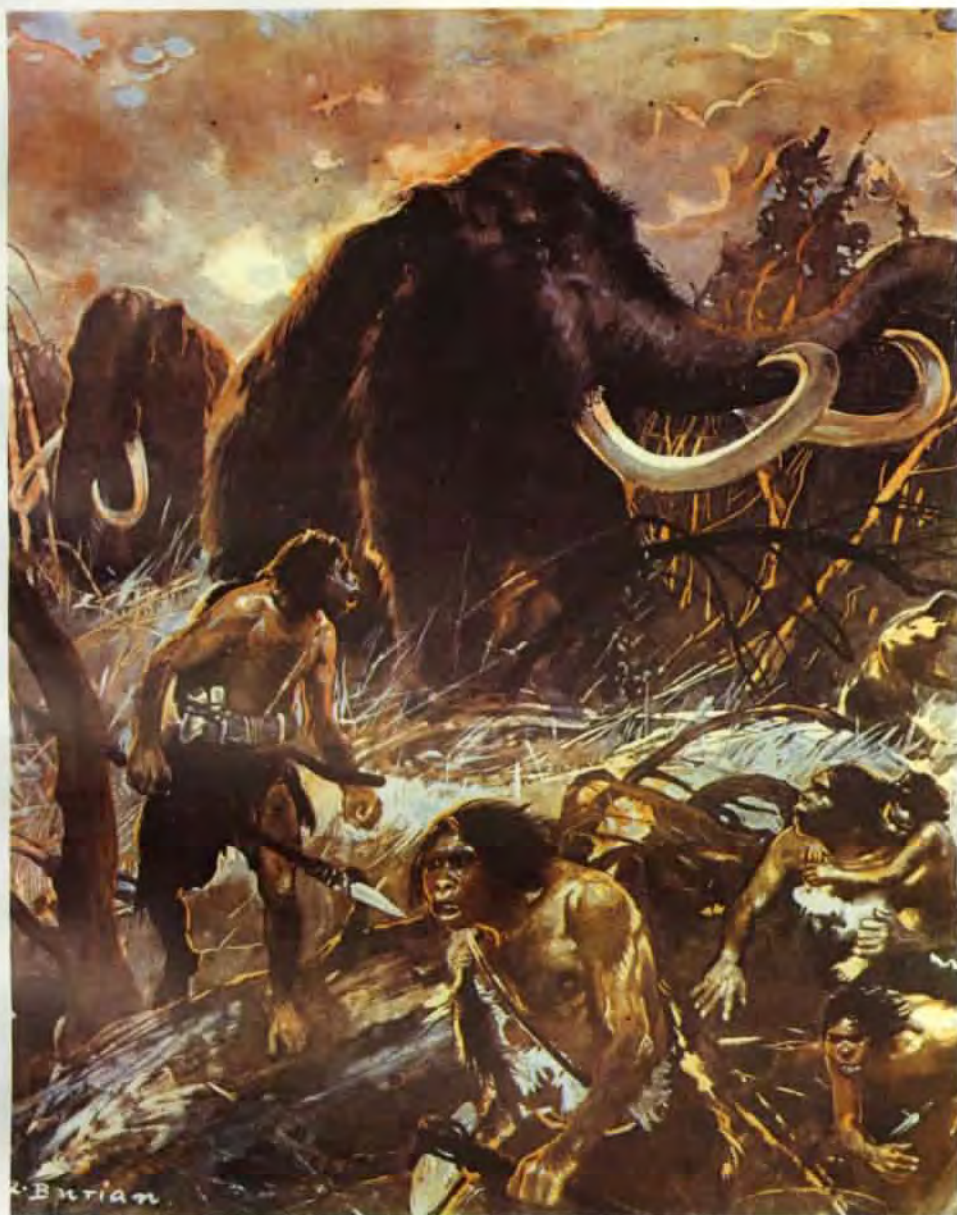
Jedna z prvních ilustrací k povídce Eduarda Štorcha Lovci sobů a mamutů (tempera z roku 1932?). Byla reprodukována v Malém čtenáři, č. 14, 1932