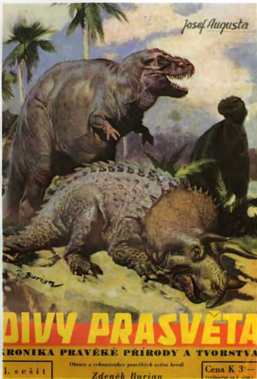
Titulní strana sešitového vydání knihy Divy pravěta (olej z roku 1940)