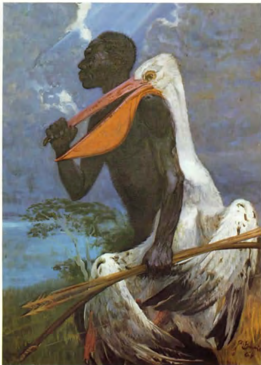
Černý lovec, olej z roku 1964, jeden z obrazů cyklu Porobení