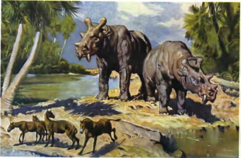
Ideální obraz krajiny v Severní Americe za doby eocenní (olej z roku 1935) — jedna z vůbec prvních obrazových rekonstrukcí Z. Buriana