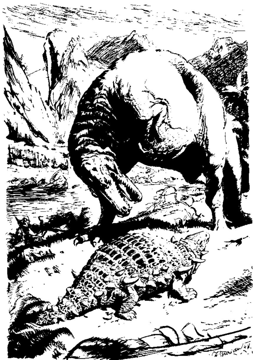
Dinodon libratus a Edmontonia rugosidens (perokresba tuší z roku 1948) — jedna z ilustrací knihy J. Augusty Z hlubin pravěku