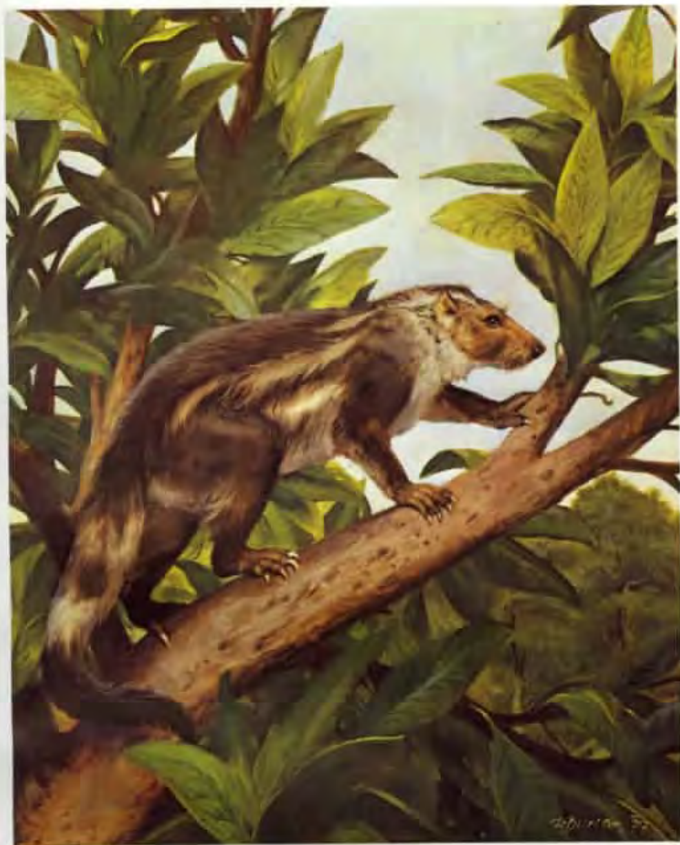
Plesiadapis tricuspidens (olej z roku 1977)