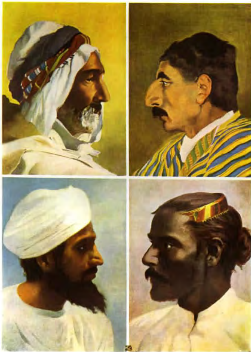
Asie III — olej z roku 1931. Je také součástí cyklu Země a lidé