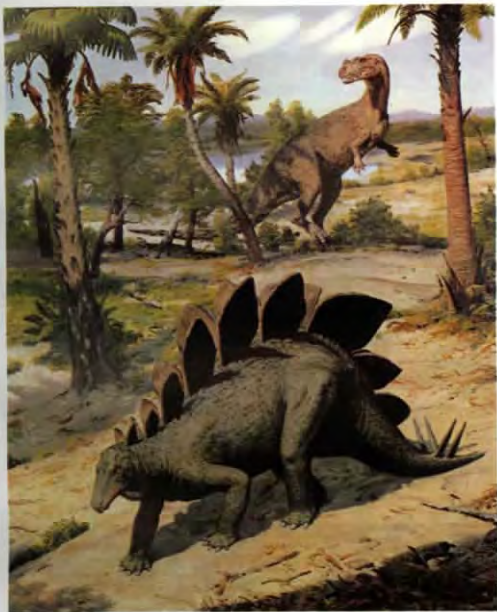
Stegosaurus unguatus a Ceratosaurus nasicornis (olej z roku 1980)