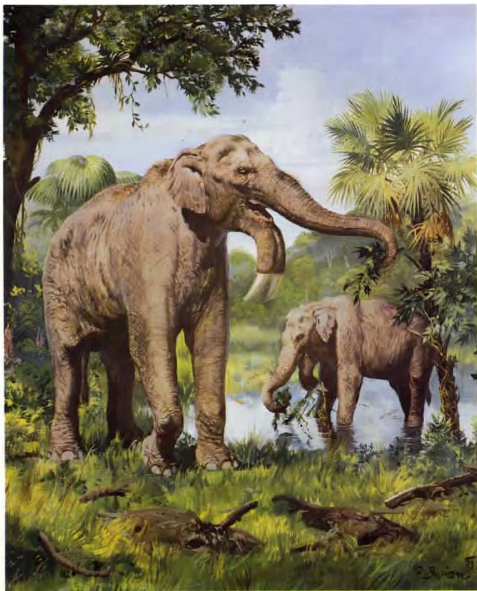
Deinotherium giganteum (olej z roku 1973)