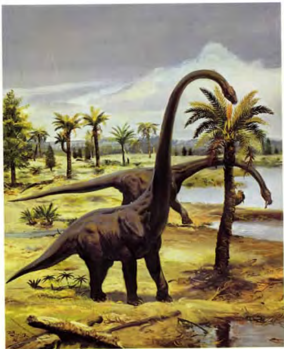
Barosaurus lentus (olej z roku 1976)