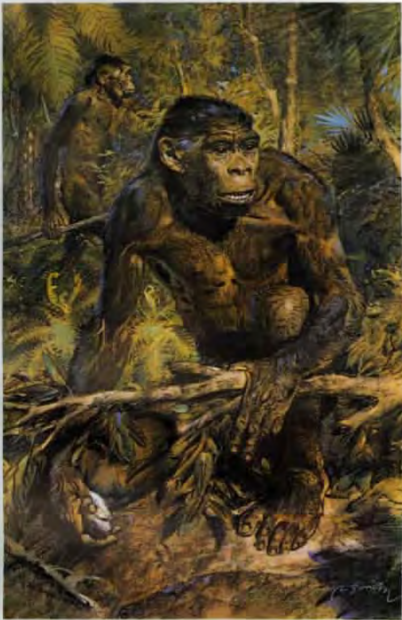
Homo erectus erectus (olej z roku 1954)