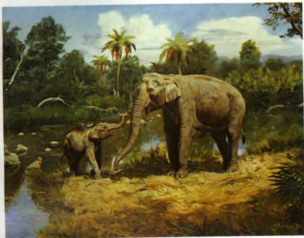
Slon indický s mládětem, olej z roku 1973. Je vyjádřením vztahu k současné přírodě