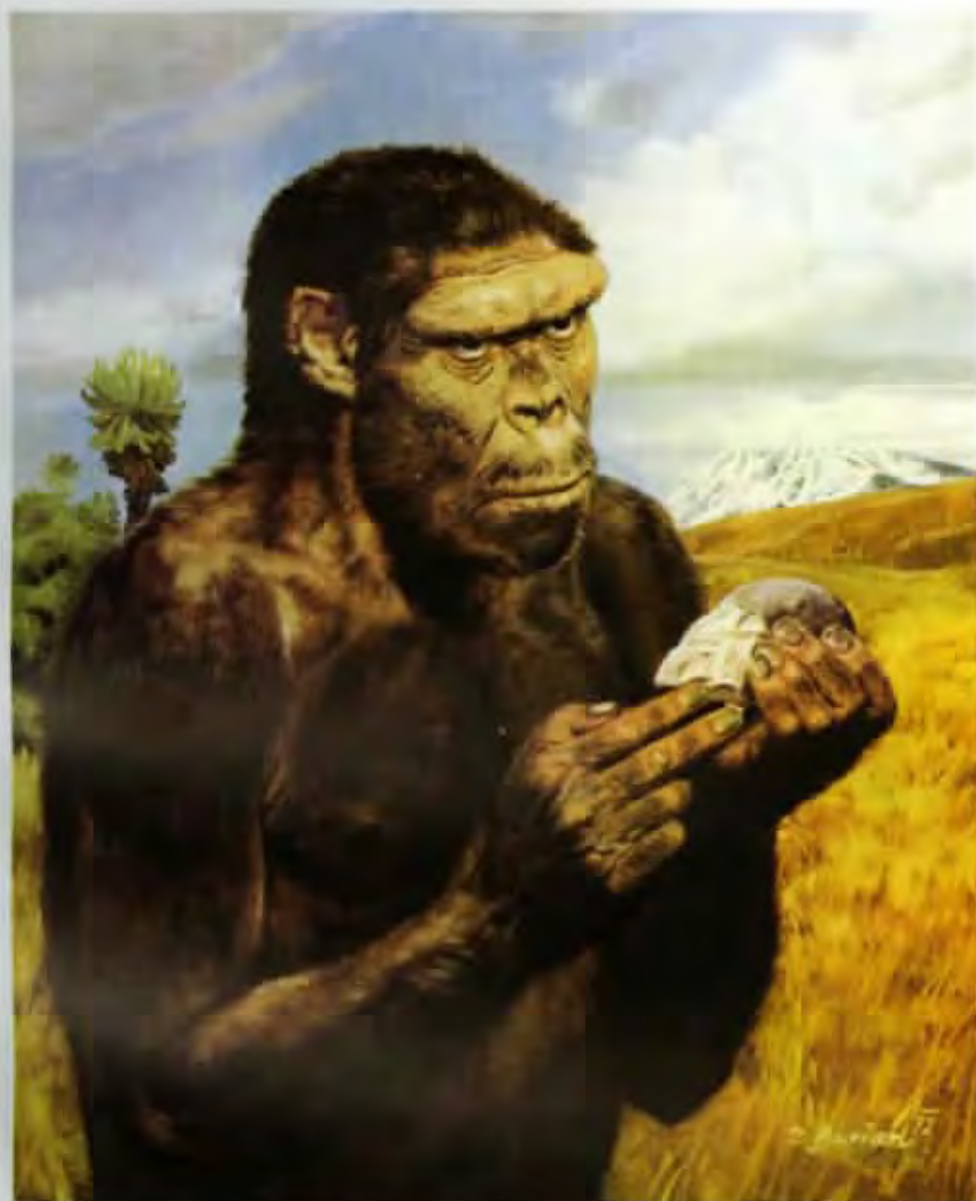
Homo erectus olduvaiensis (olej z roku 1972)