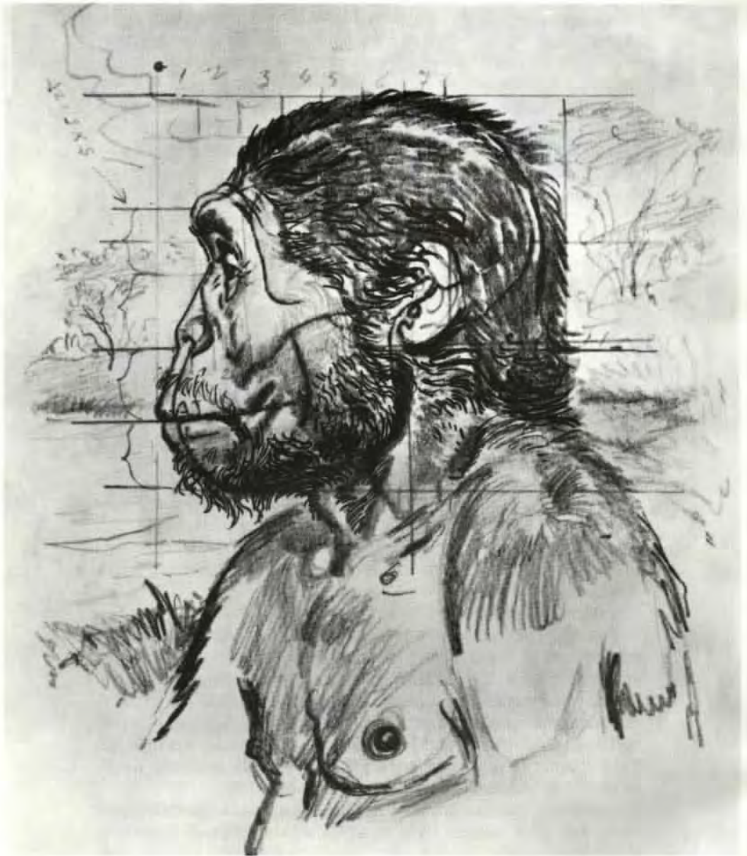
Homo ergaster (kresba tužkou a tuší z roku 1975); tato kresba dokumentuje pečlivou přípravu před vznikem každé rekonstrukce