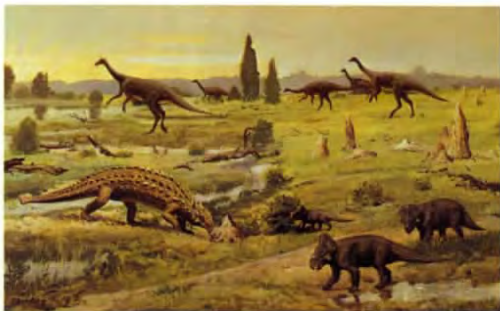
Ankylosauria (olej z roku 1976)