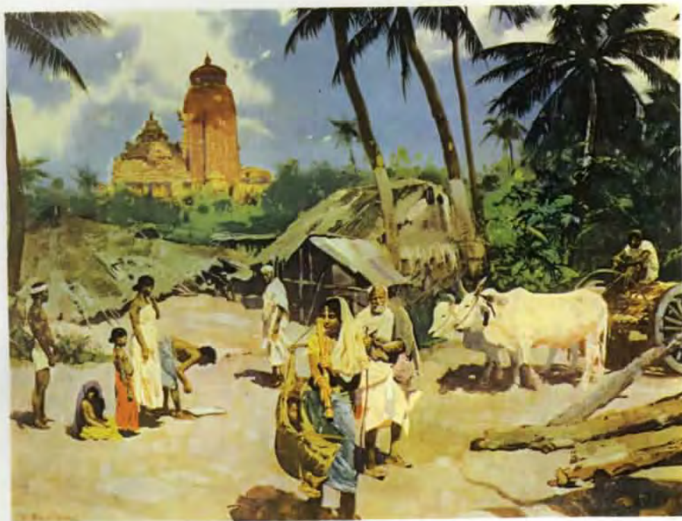
Na indické vesnici — olej z roku 1930; tento obraz je součástí cyklu Země a lidé