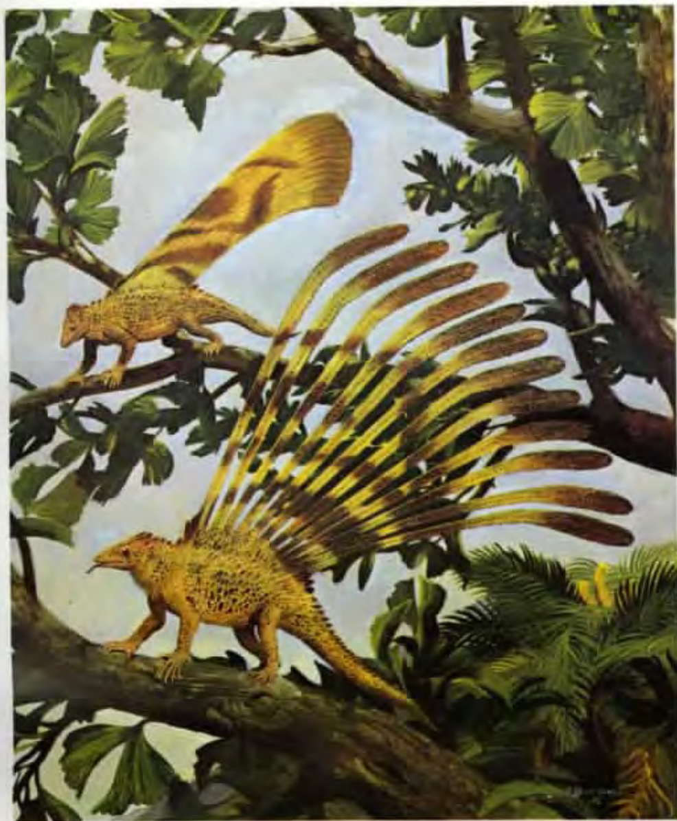
Longisquama (olej z roku 1976)