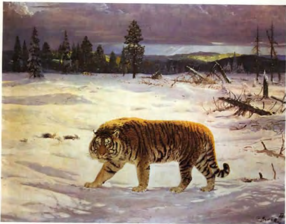
Tygr ussurijský, olej z roku 1966