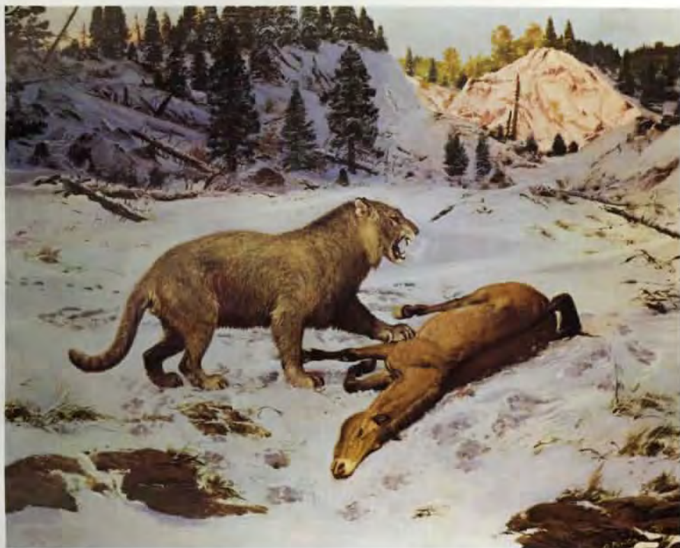
Panthera fossilis (olej z roku 1970)