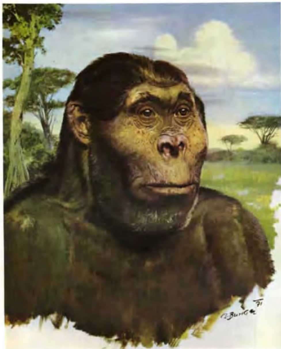
Paranthropus boisei (olej z roku 1971)