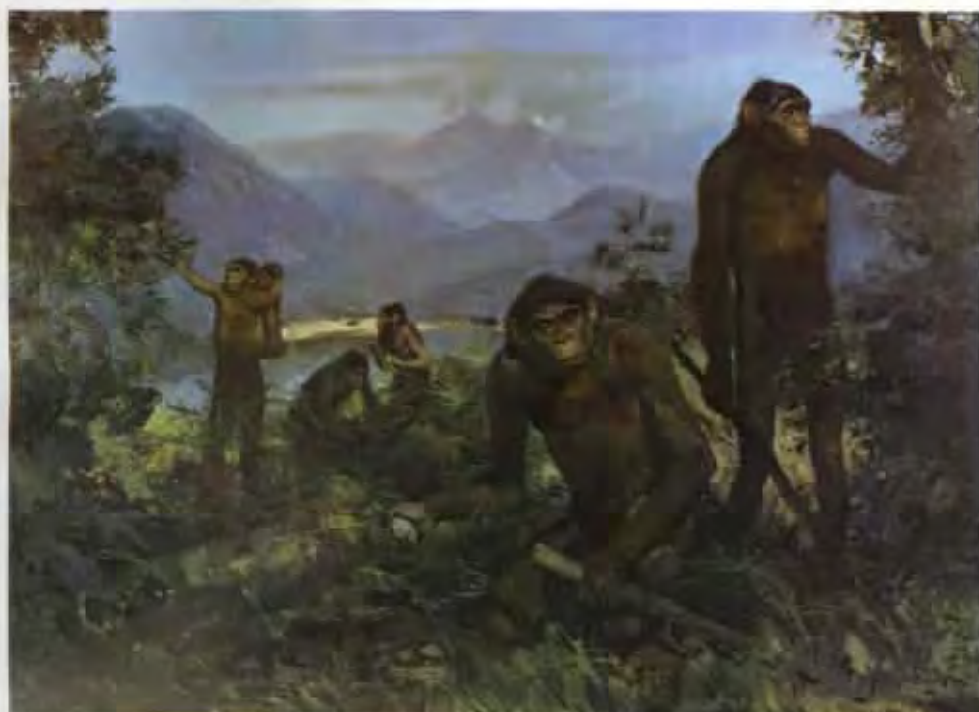
Homo erectus erectus (olej z roku 1955)