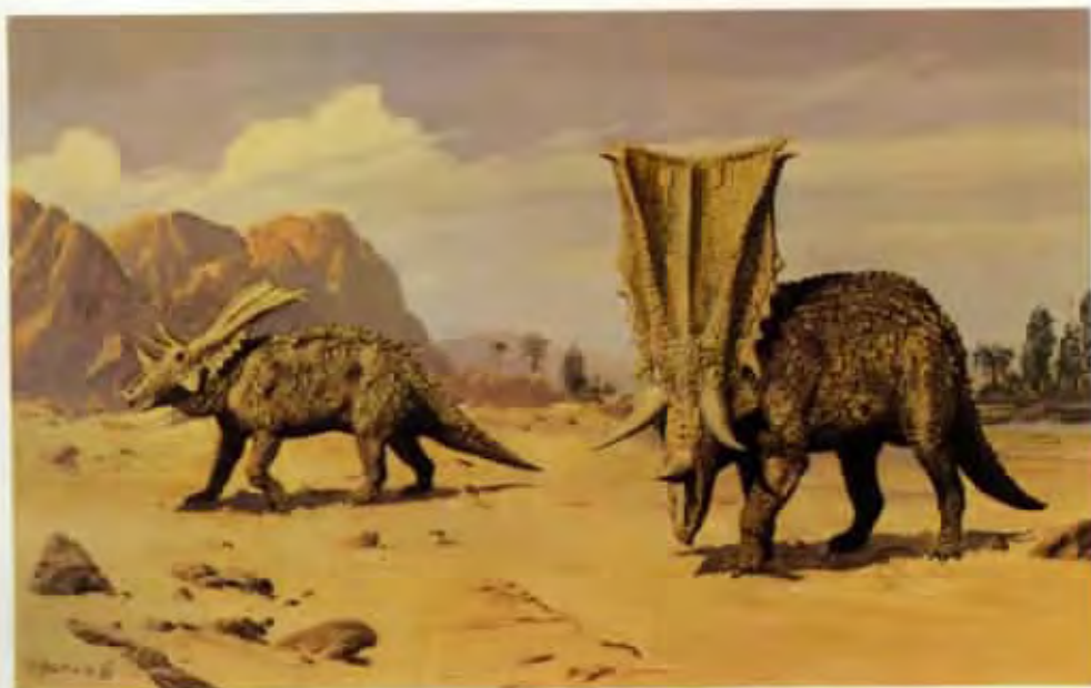
Chasmosaurus belli (olej z roku 1976)