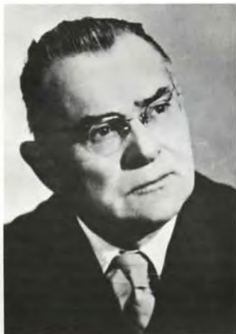
Prof. RNDr. Josef Augusta, DrSc.