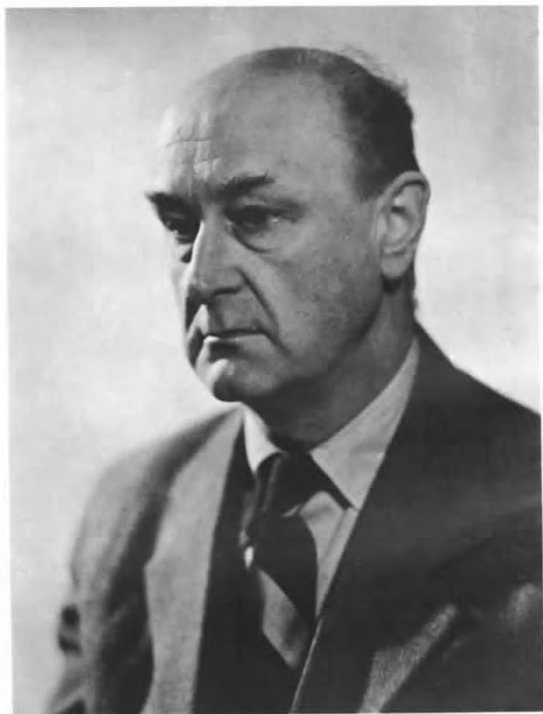
Zasloužilý umělec Zdeněk Burian