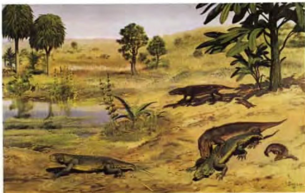
Thrinaxodon liorhinus (olej z roku 1975)