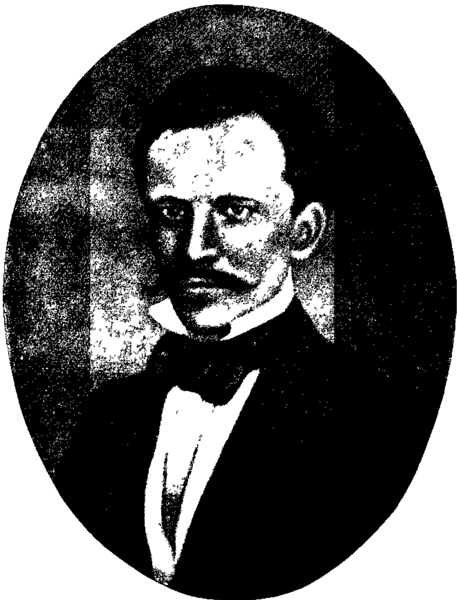
ПѢТРЪ ПЕТРОВИЧЪ СЕМѢНОВЪ, впосл. Семѣновъ - Тянь - Шанскій, в 1854 г.