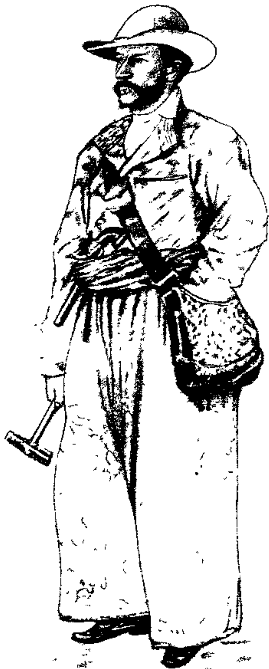
ПЁТР ПЕТРОВИЧ СЕМЁНОВ.