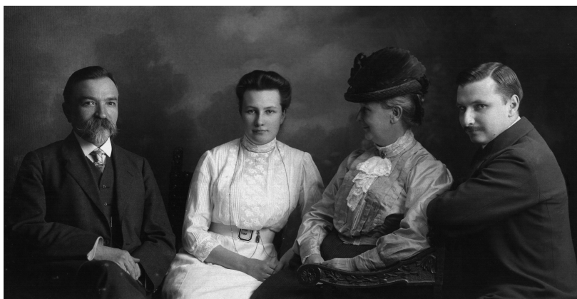
Семейное фото. 1912 г.