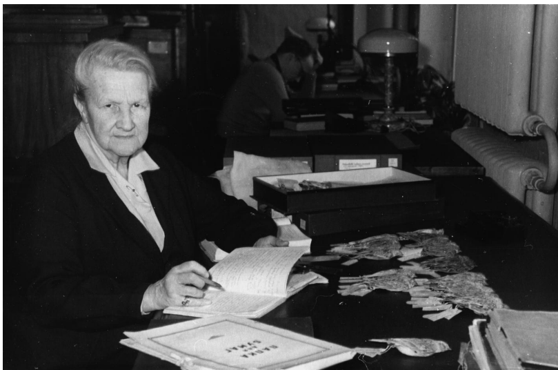
В хранилище орнитологических коллекций Зоологического института