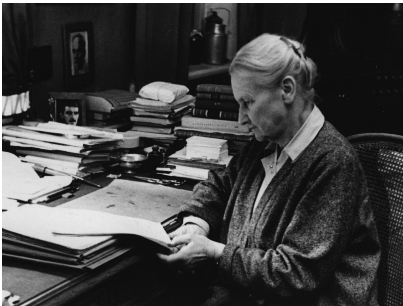
Дома, за рабочим столом. 1970-е гг.