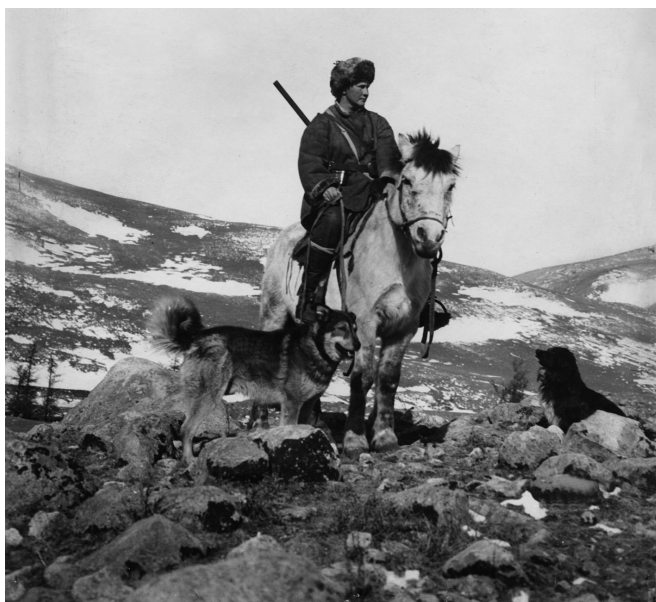
В Монгольской экспедиции П.К. Козлова