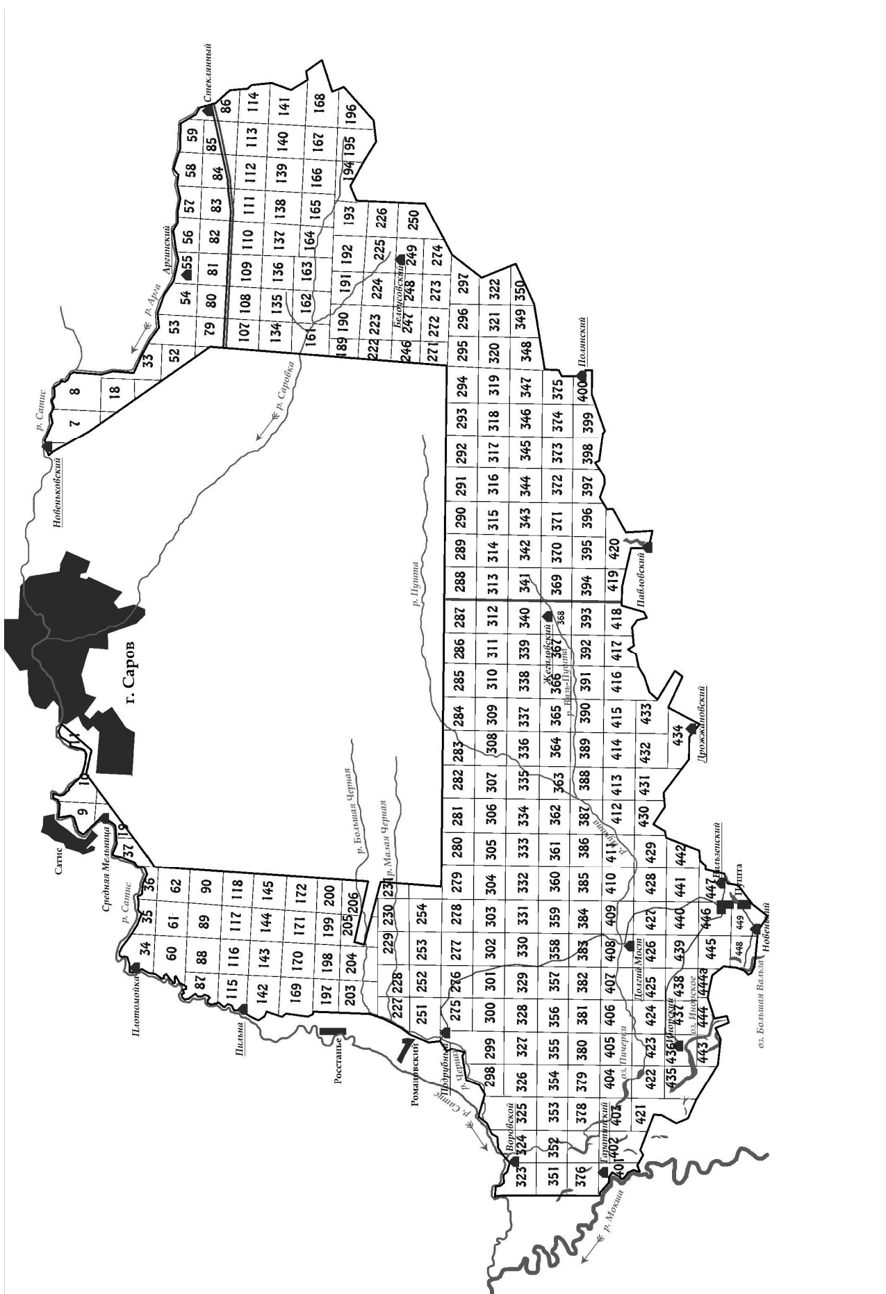
Рис. 1. Современная карта-схема Мордовского заповедника с обозначениями кварталов