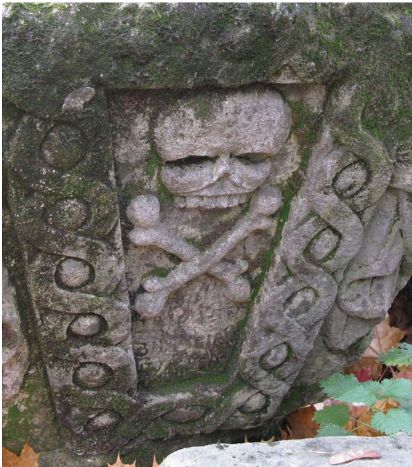
Рис.8. Символ смерти и бессмертная двойная спираль – деталь надгробия на кладбище Донского монастыря в Москве.