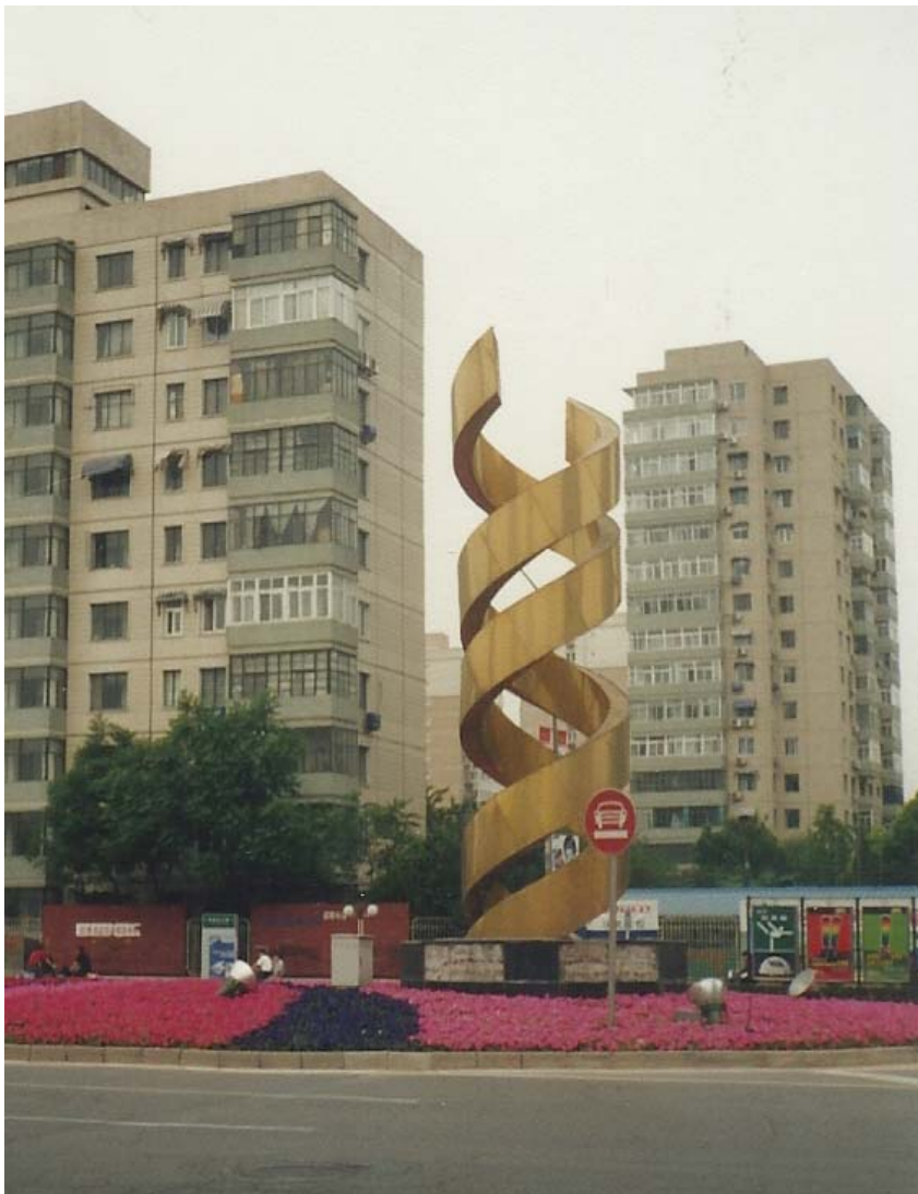
Рис.7. Скульптура – «Двойная спираль ДНК» на проспекте в Пекине (КНР).