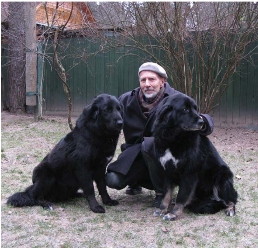
Рис.2. Я с тувинскими собаками в Подмосковье.