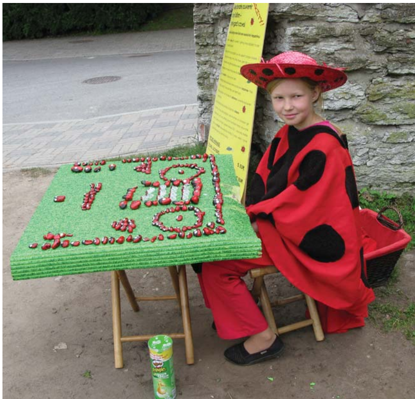
Рис.1. Продажа сувениров-божьих коровок (Благотворительная акция, Таллин).