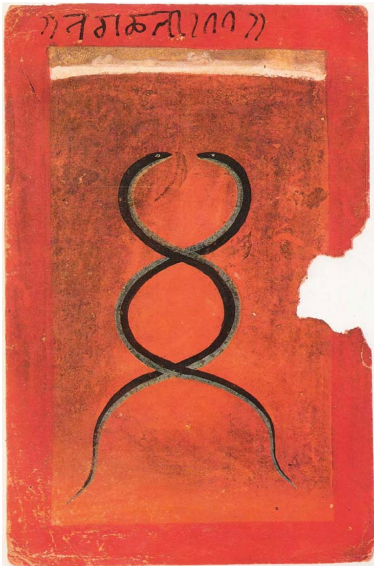
Рис.6. Две переплетенные змеи – символ космической энергии, Индия, ок. 1700 г. (из Rh.Rawson. The art of Tantra. 1973).