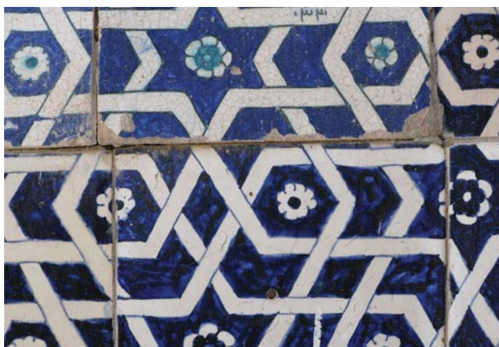
Рис.5. Дворик гарема хивинского хана и деталь орнамента. Хива, Узбекистан.