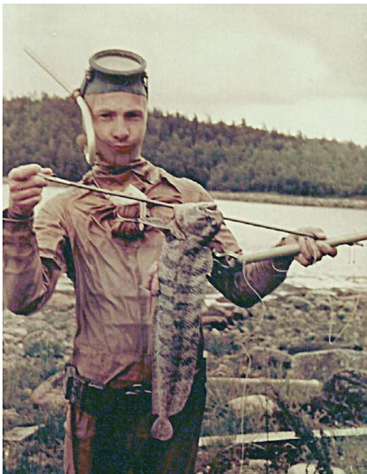
Рис.3. Я на Белом море, 1962 год.